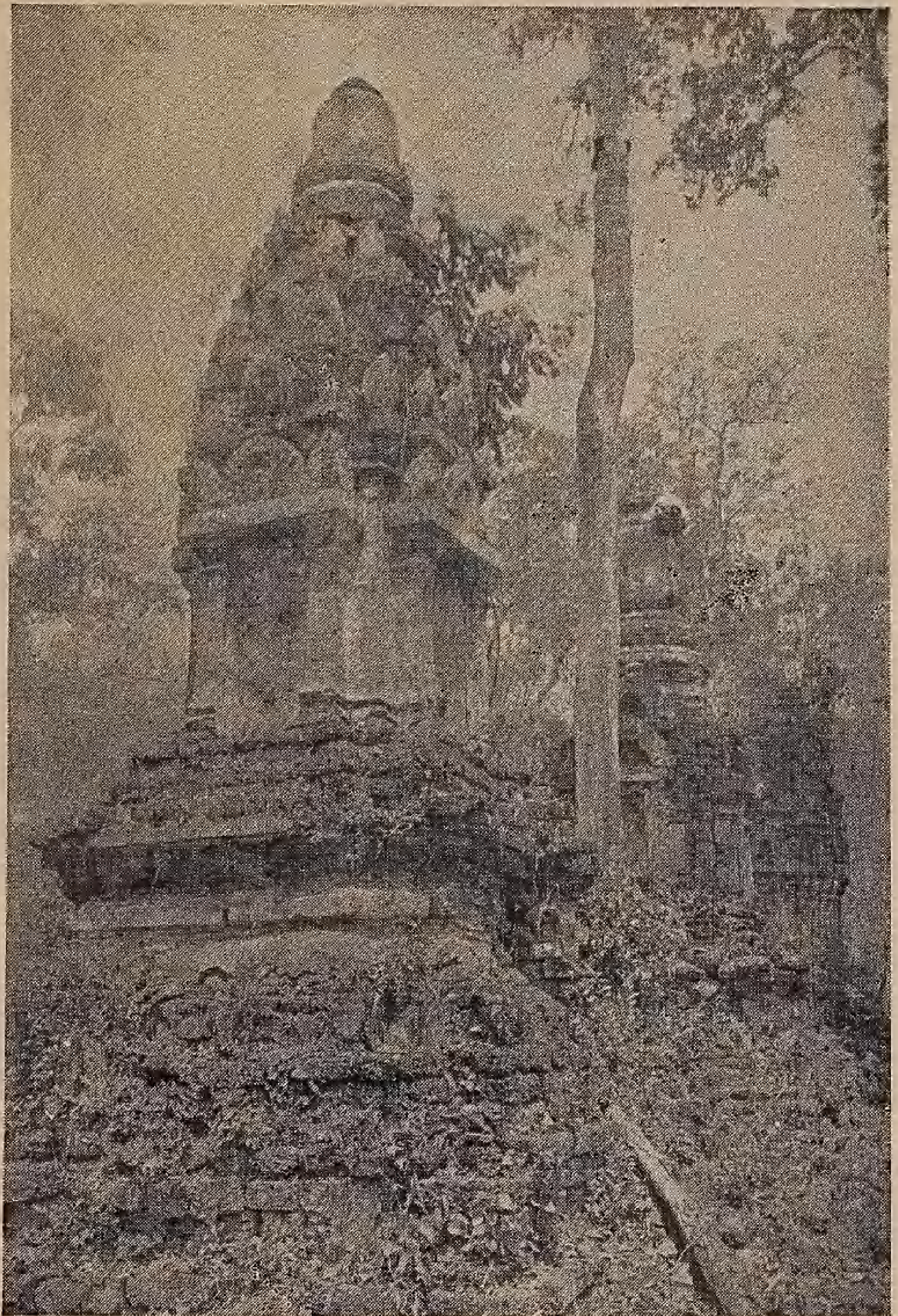
สถาปัตยกรรมสุโขทัย วัดเจดีย์เจ็ดแถว เมืองสุโขทัย เป็นที่ประดิษฐานพระอัฐิธาตุพระราชวงศ์สุโขทัย