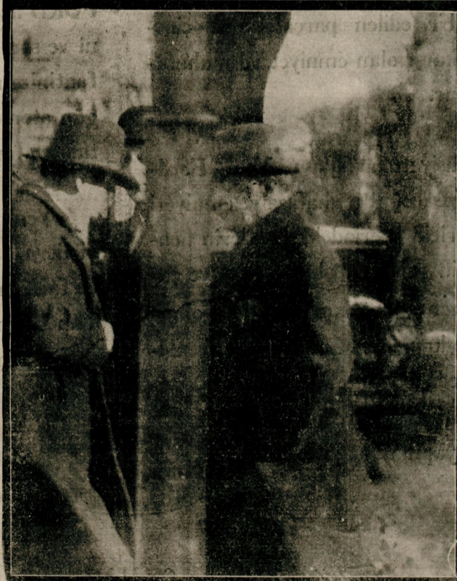
Cemiyeti Belediye dün son içtimamı aktetmiştir. İçtimadan sonra azalar Şehremaneti binasını terkederken.