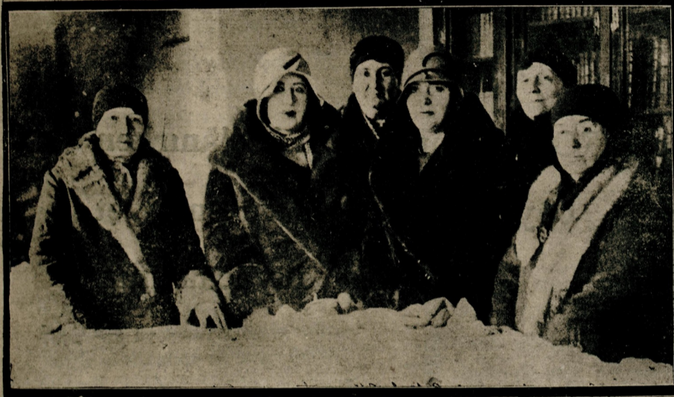
Türk kadınları Esirkeme derneği tarafından Türk ocağında bir sergi açılmıştır. Sergide kadın işleri gösterilmektedir.