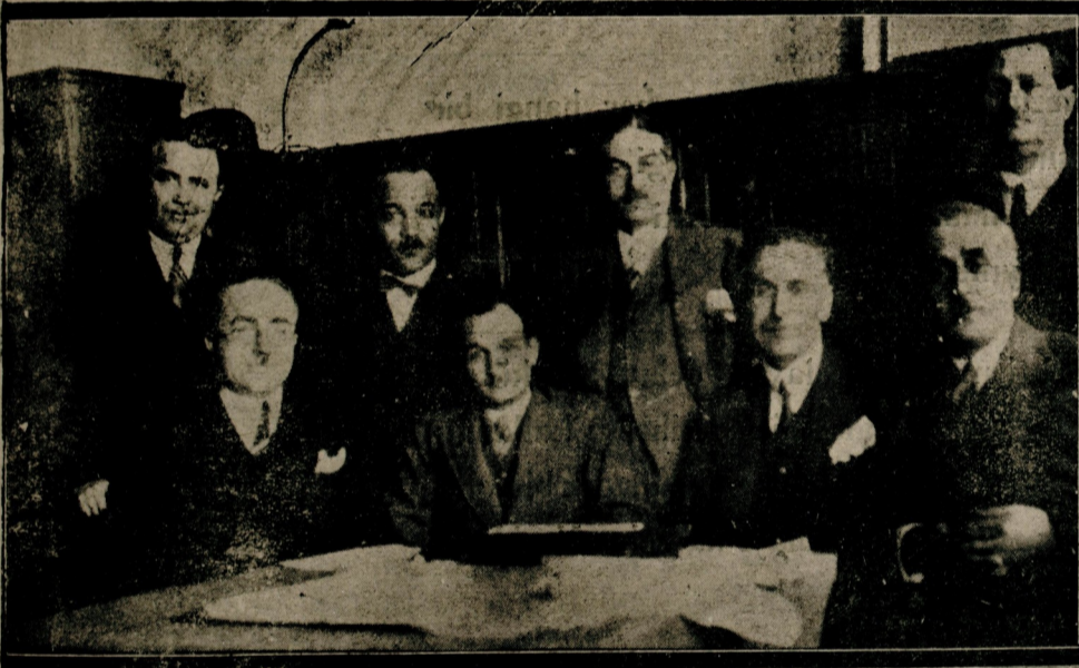
Üsküdar - Kadıköy ve temdidî halk tramvayları heyeti idaresi d i n bir içtima aktetmiştir.