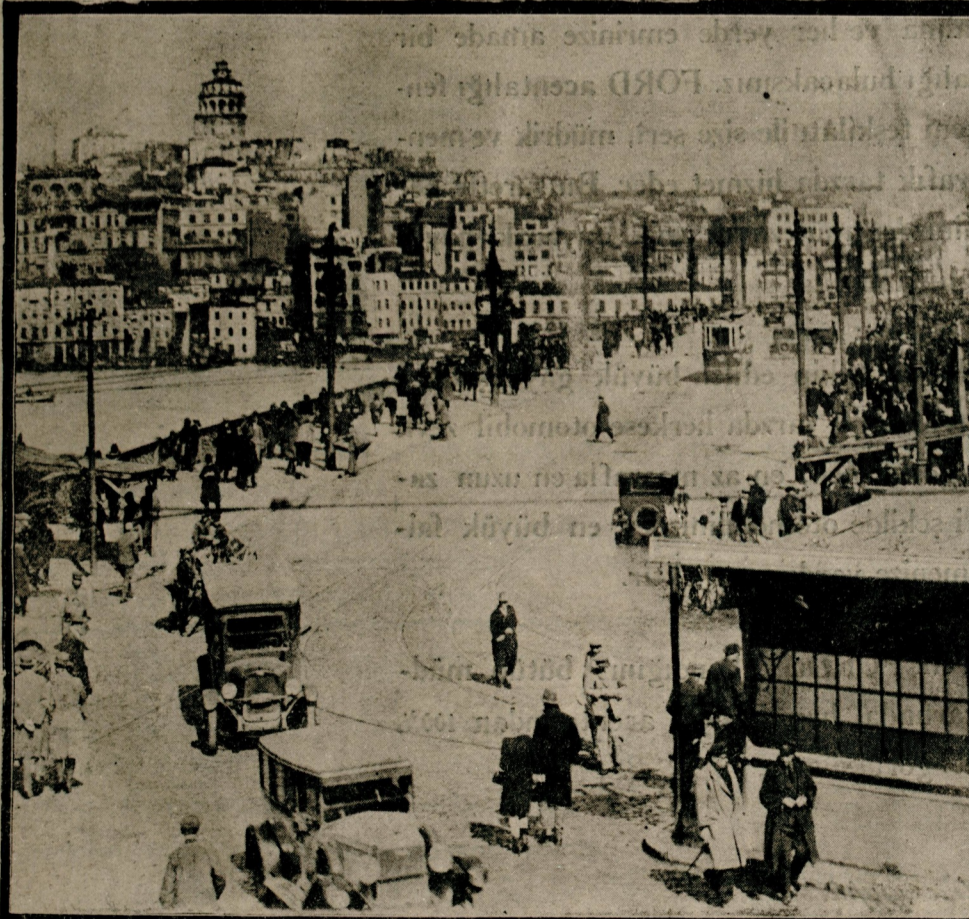
Günlerdenberi kar, tipi, sis, duman altında kalan İstanbul nihayet kıştan kurtuldu. Dün hava güneşli ve çok güzeldi.