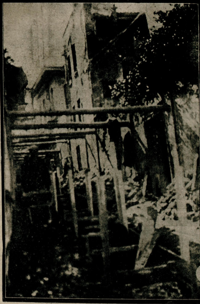
Dar sokaklarda açılan kanalizasyon çukurlarına uzun destekler konmakta ve bu suretle evlerin her hangi bir suretle yıkılmasına mani olunmaktadır.