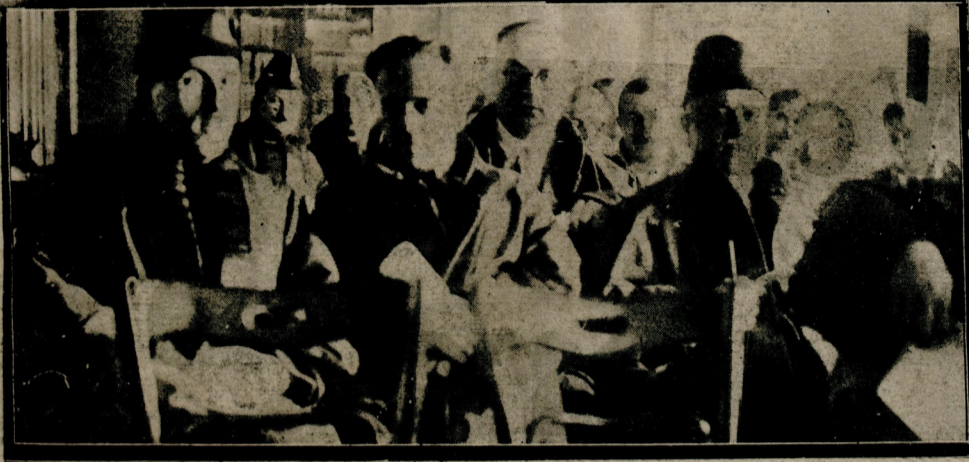
Baro heyeti umumiyesi dün bir içtima aktederek münhal meclisi inzibat azalarını intihap etmiştir.