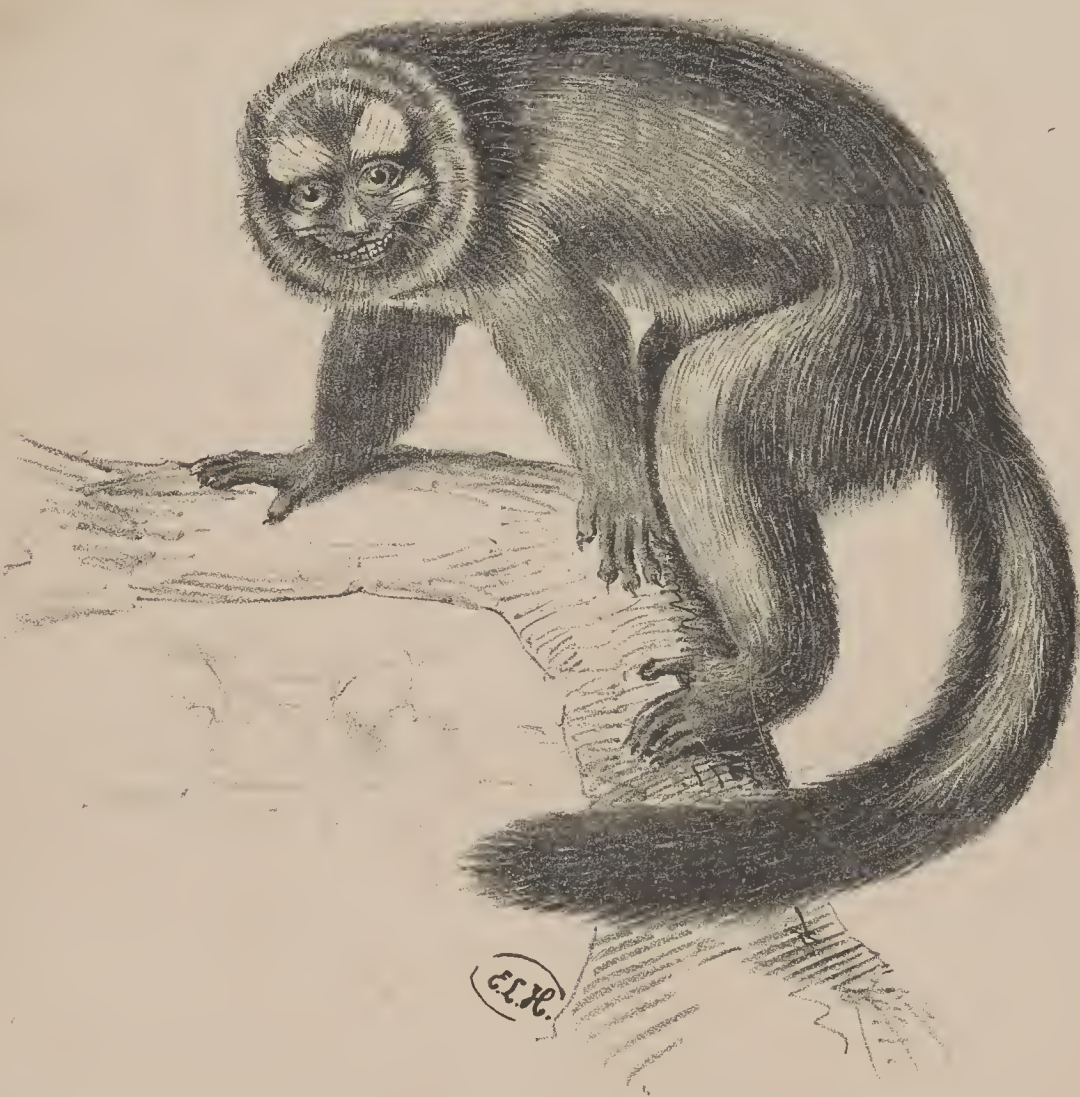
Nyctipithecus felinus , Spix.