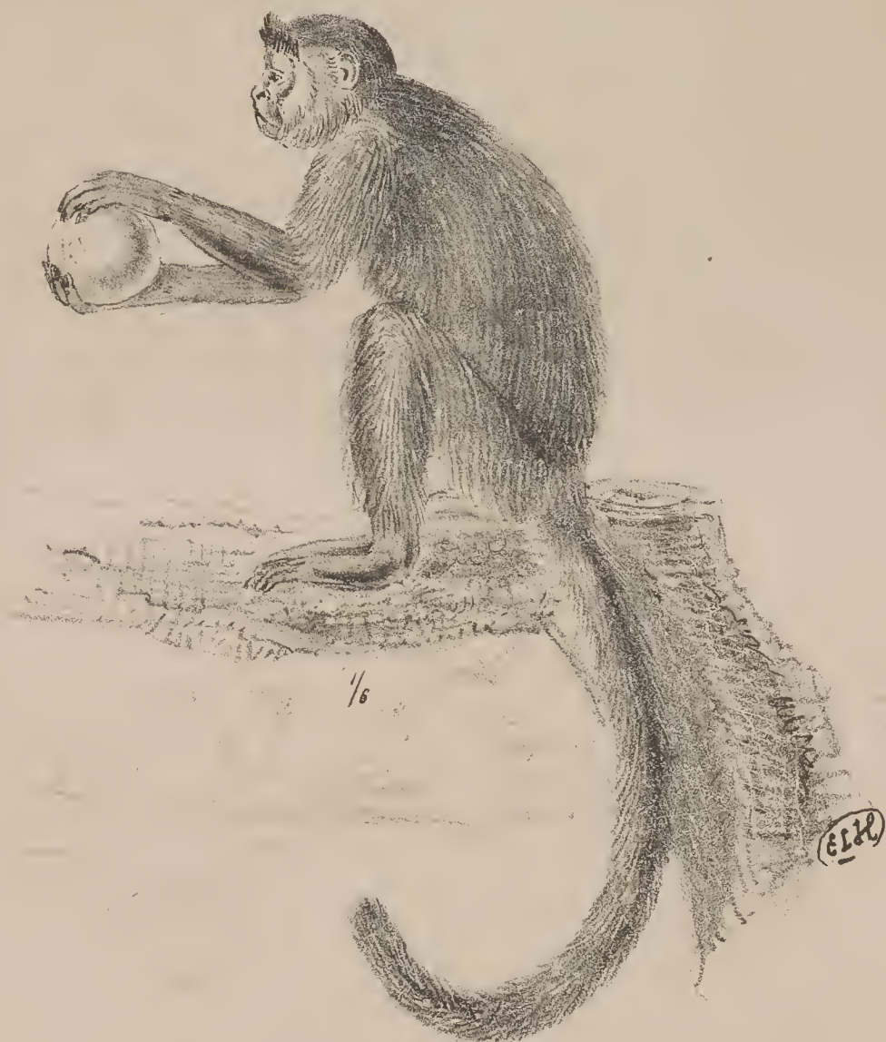
f.3. Cebus fatuellus, Erxleben