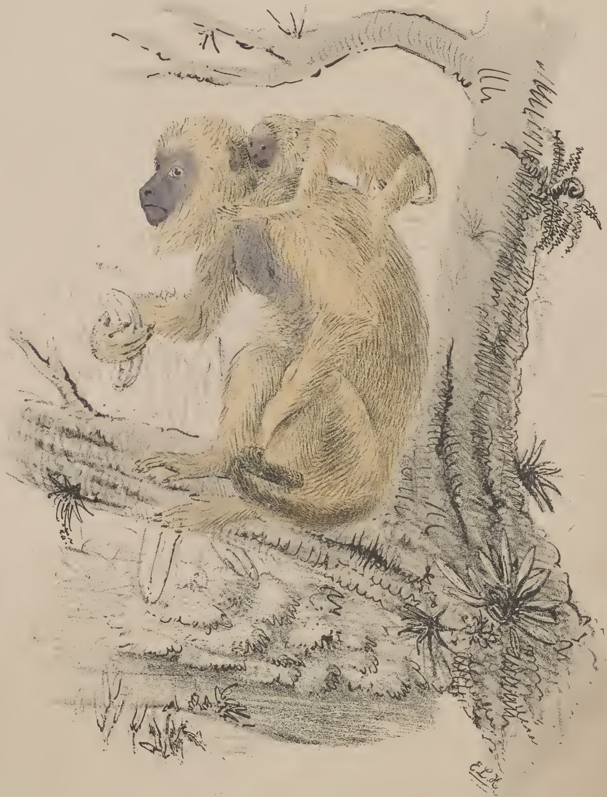
f. 2. Mycetes caraya . Desmarest Caraya (hembra con su hijuelo.)