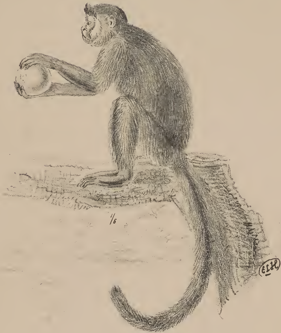
f.3. Cebus fatuellus, Erxleben