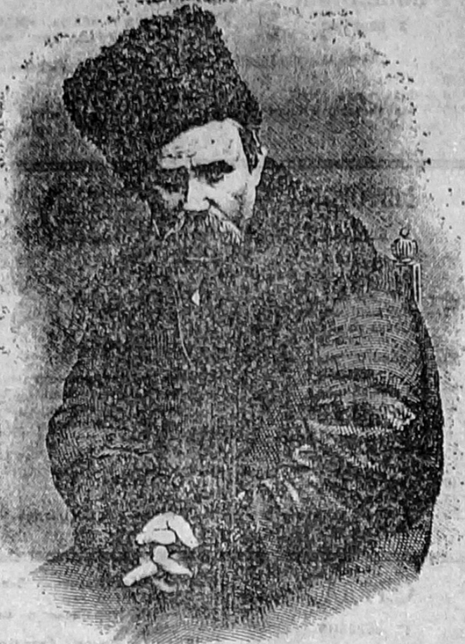
Цей рідкісний портрет Тараса Григоровича Шевченка прикрашає фронтистис «Кобзаря», якого видано в С-Петербурзі в друкарні В. С. Балахвара.

Шевченко, як і всі великі люди, народився в родині селянина. Але стільки він пережив, стільки зробив! Навіть найголовніші віхи з його біографії не оповісти в одному з наших номерів!