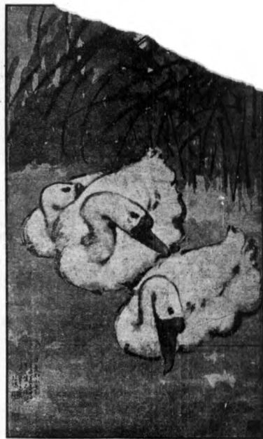
悲矣華宗作。二寫夏季年如日：詞此作他家藝爲上 一鴻。兒白游元福第求。小昆一爲選，鴻徐兩名圖