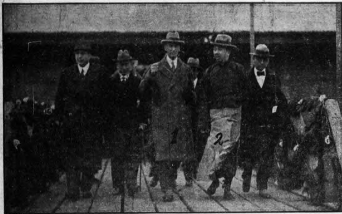
國聯調 查團抵 南京下 關後上 岸時之 情形圖 (一) 爲團 長雷頌 (二) 羅文幹 (三) 顧維鈞 (四) 義代表 斯可狄