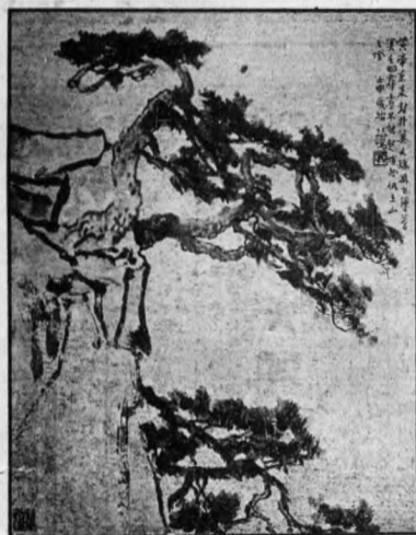
鴻始王之仍。不問冥古天於東一副作爲上 。申陰立情能將。荷姑實來黃日。君徐閱 「悲哉。山然悲離千蒼萬。封帝：題所悲亦

下圖係 拚合載 有關於 我國滬 戰消息 日報而 語者。 其中之 「小巴 人報」 高揭 蔡廷楷 之電傳 寫其 餘如 林日 報 阜日 報 均有 報主 持之 標題。