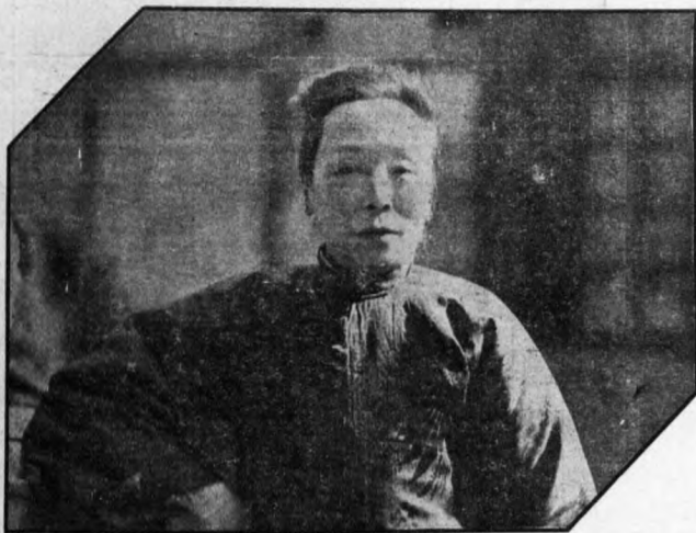
右圖爲賽金花最近之肖像