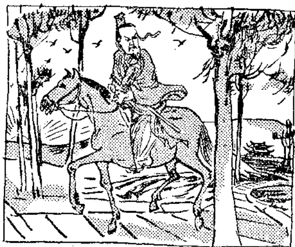
去國秦到國魏開離鞅商

春秋、戰國的時代，說客盛行。就是憑自己胸中所學，到各國去見諸侯，告訴他強國的方法，只要有一國的諸侯聽從了他的說話，這一個說客便可平步青雲，出將入相了。這是不限定國籍的，楚國的人可到秦國去；同時秦國的人也可以到楚國去。不過人來人往都是素昧平生，不知道根底。做諸侯的若個個貿然接見，難免有懷異志，對己不利的份子夾雜在內。為防備這層起見，每一個異國人要來充說客，必須要經過本國大夫介紹，方可入見。公孫鞅自亦免不了這種手續。他先備下許多禮物，一到秦國，就先去拜訪孝公的寵臣景監，託他在秦孝公面前美言幾句。景監事先也聽到有公孫鞅這麼一個人；並約略知道公叔痤薦公孫鞅自代的這件事。公叔痤是位賢相，他所佩服而肯舉薦的人，想情是不會差的；況且「進賢受上賞」，只要孝公看得中，能重用公孫鞅，我這個介紹人一定也有莫大好處，何樂而不為呢。因此在景監竭力的說項下，進說孝公的目的，終於被公孫鞅達到了。