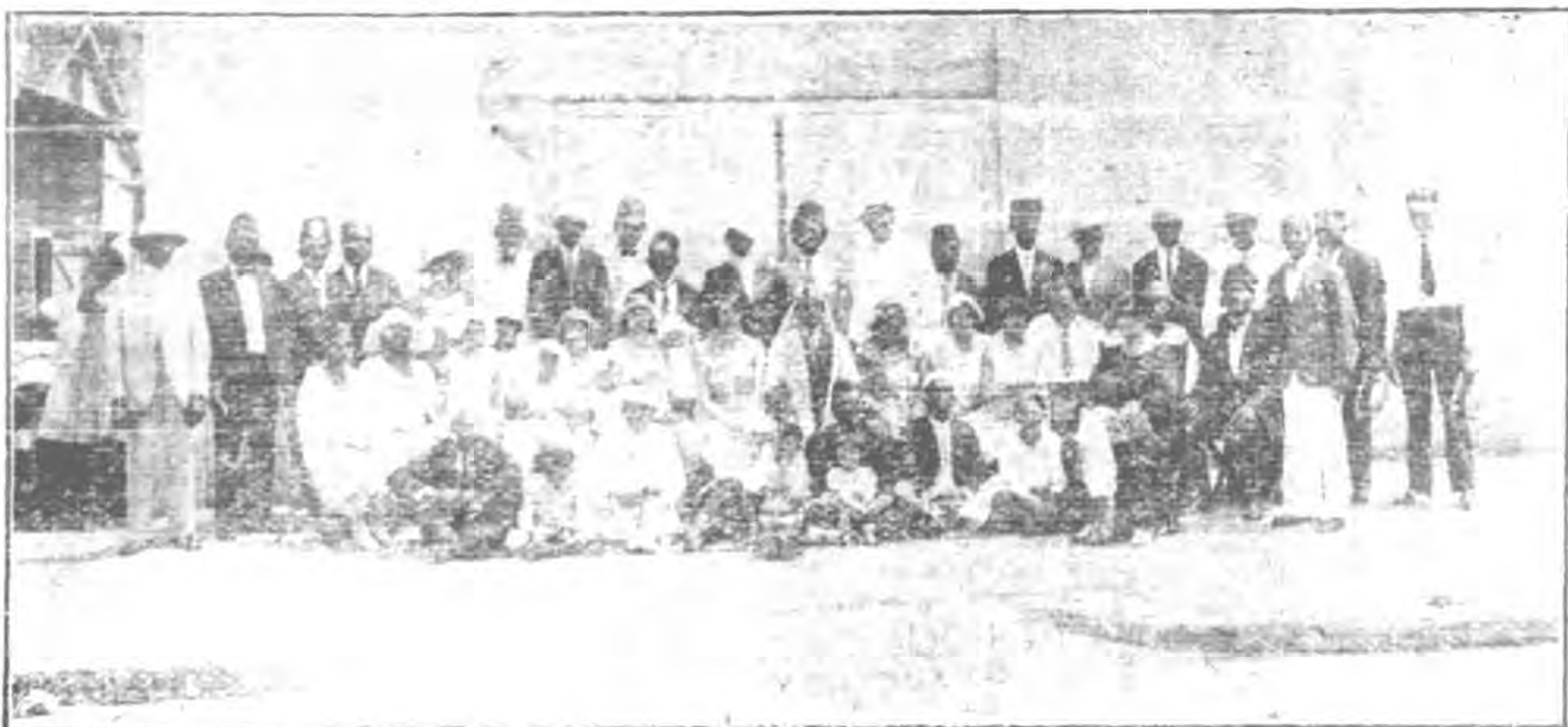
影合之日節邦爾古在徒教回馬拿巴

的。這却不然。替聖傳道。不必一定收海立凡。只要自己肯向外傳。每日破上兩三個鐘頭的工夫。把本方治下。那些沒有宗教知識。及那些長而失學的人們。招集在寺內。講給他們些。正道的真諦。使他們得些的確的認識。堅固他們對教的信仰。和觀念。不使悞入歧途。這正是本方阿訇的專責。我敢說這種功德。不在開學收海立凡之下。況且仍然去代人頌經。出外了事。對於收入上。一毫亦不受影響。於阿訇的尊嚴面子上。也不見得減色。不過出門時。少了二三個隨從罷了。鄉老方面。更要去掉私見。不必執定總得供給本寺的海立凡。才有回賜的。供給別處的海立凡。便沒有回賜的。更不要賭那種無意識的競賽。有幾個海立凡。寺便大啦。沒有海立凡寺便小啦。