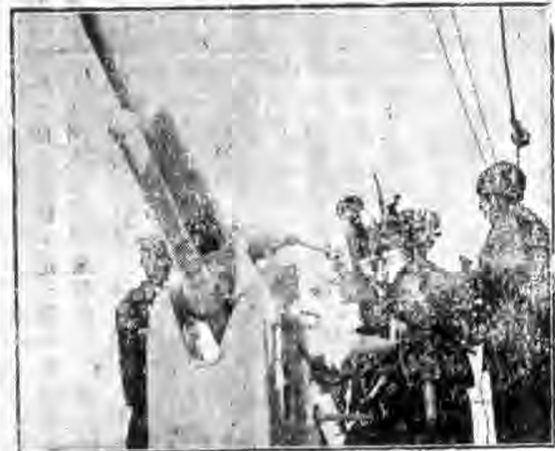
逸仙軍艦偵察高射砲攝影

公勝砲艇，二十五日下午六時半寄龍潭港，二十六日五時半開行，下午二時半寄吳淞，二十七日上午三時開行，下午五時寄龍潭港，二十八日上午五時半開行，九時抵象山拋錨。 江元軍艦，二十五日上午五時三十分由上游抵滬寄錨，二十六日上午六時五分由上游抵滬寄錨，二十六日上午六時五分開行，八時一刻寄龍潭港，二