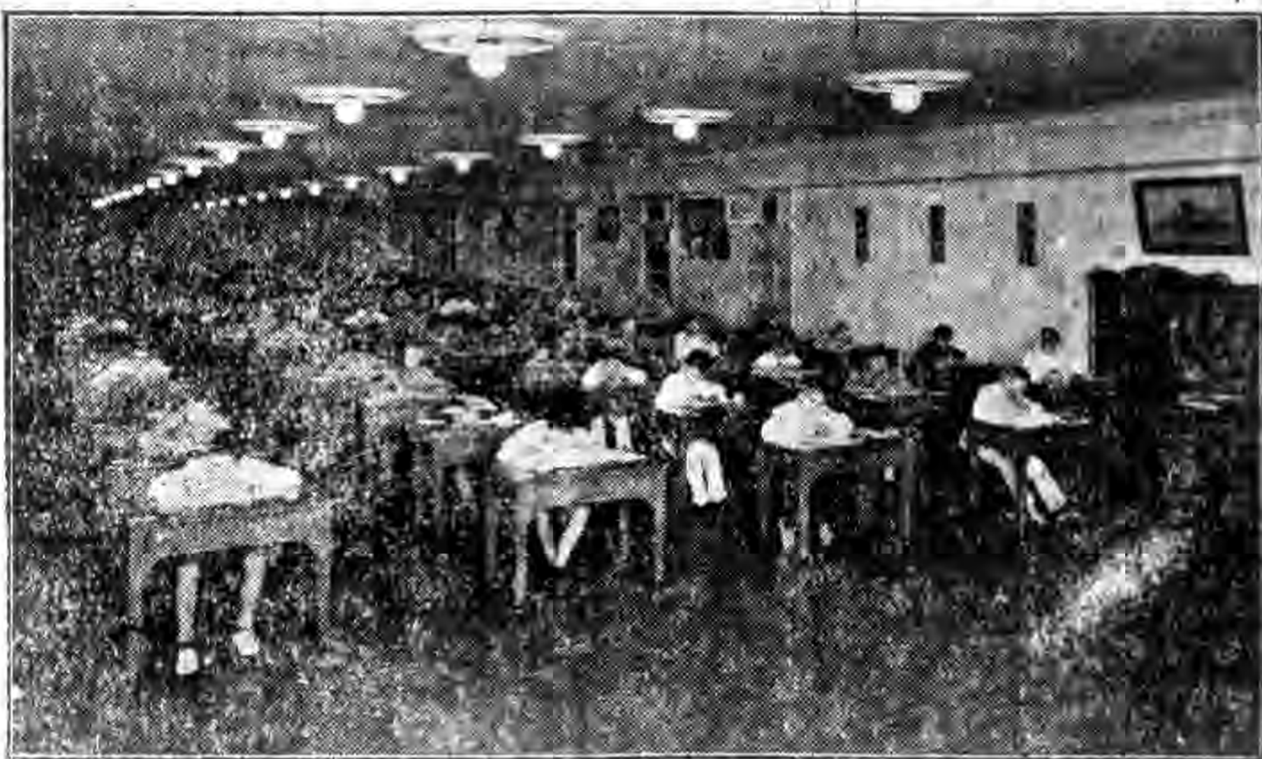
海部新招學生考試時攝影

楚觀艦長俞俊偉因病出缺，據呈報後，海部經以部令發表，將該艦長薪俸公費，均截至十月三十一日止。所遺楚觀艦長一缺，以練習艦隊司令部參謀任光海調任，遞遺該參謀一缺，以建康艦長劉孝黎升任，遞遺建康艦長一缺，以江銀艦長戴熙經升任，遞遺江銀艦長一缺，以海容副長王夏和調任，遞遺海容副長一缺，以通濟副長周應聰調任，遞遺通濟副長一缺，以甯海槍礮正鄧兆祥升任，遞遺甯海槍礮正一缺，以江甯艦長甘禮經升任，遞遺江甯艦長一缺，以本部軍需司銜技科員吳際賢調任，薪俸均准從十一月一日起支。王夏和，吳際賢，准支江銀，江甯等艦艇交際費二成，其文具消耗雜支等項，應照案實報