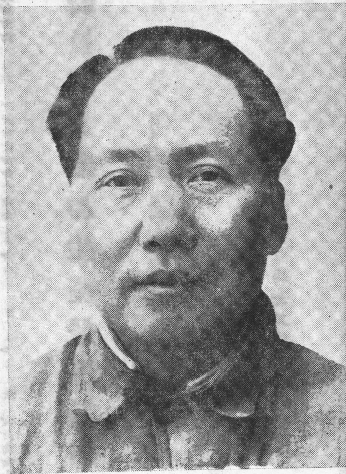
中國人民領袖毛澤東