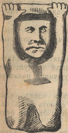
Дажбогъ, держачїй на собѣ Скитїю.

— Якѣ то будуть, по вашѡй гадцѣ, люде на сѣмъ образку? — спытавъ я селянъ.