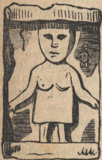
Фігура середущого поверху.

Фігури середущого поверху представляють такожъ двѣ пары людей, мужчинъ и женщинъ. Руки въ позиціи такій, якъ коли-бъ всѣ фігури докола статуѣ держались за руки — була-бы то красна мысль, наглядне представленьє о потребѣ згоди въ родинѣ и народѣ. Ще нинѣ въ великоднихъ забавахъ дѣвчата наслідують середущій поверхъ статуѣ въ той способъ, що творять „коло“ и держаться за руки.