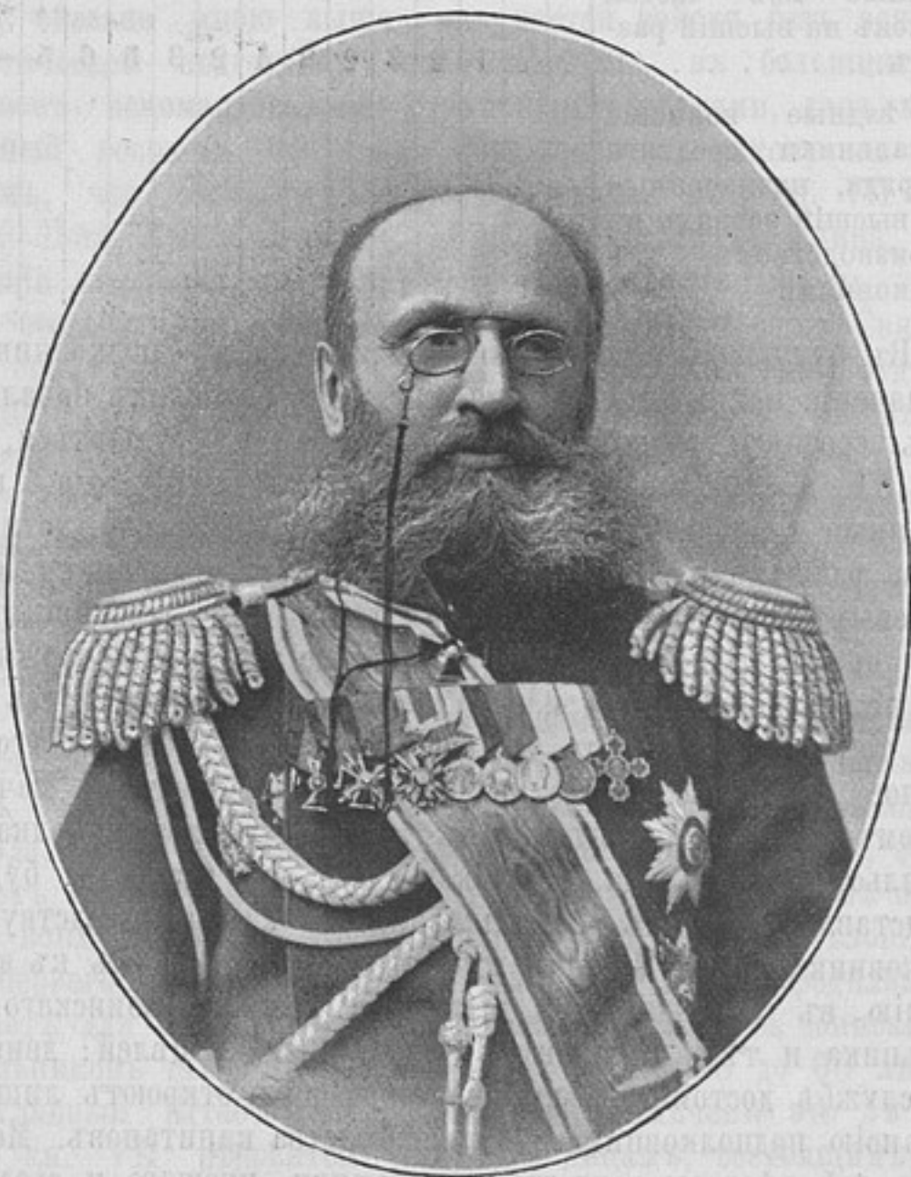
Военный губернаторъ Приморской области, командующій, въ оной войсками и наказный атаманъ Уссурийскаго казачьяго войска, генераль-маіоръ

Денги могутъ быть высланы почтовыми марками каждая не дороже 50 к. Безденежная подписка не принимается. За перемѣну адреса 25 к. Отдѣльные №№ выслаются за 15 к. Объявленія принимаются по особой расцѣнкѣ, выслаемой по требованію.