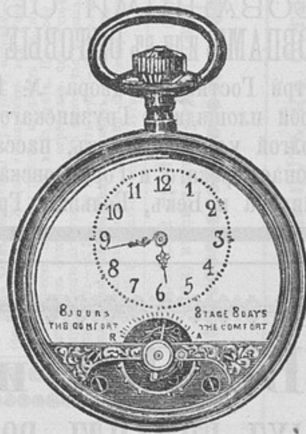
Нормальн. величины. Анкерный ходъ.

ВОСЬМИДНЕВНЫЕ ЧАСЫ по небывало дешевымъ цѣнамъ.