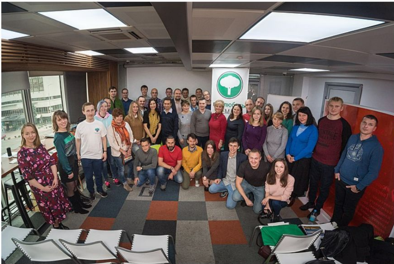
Церемонія нагородження фотоконкурсу «Вікі любить Землю» у 2019 році