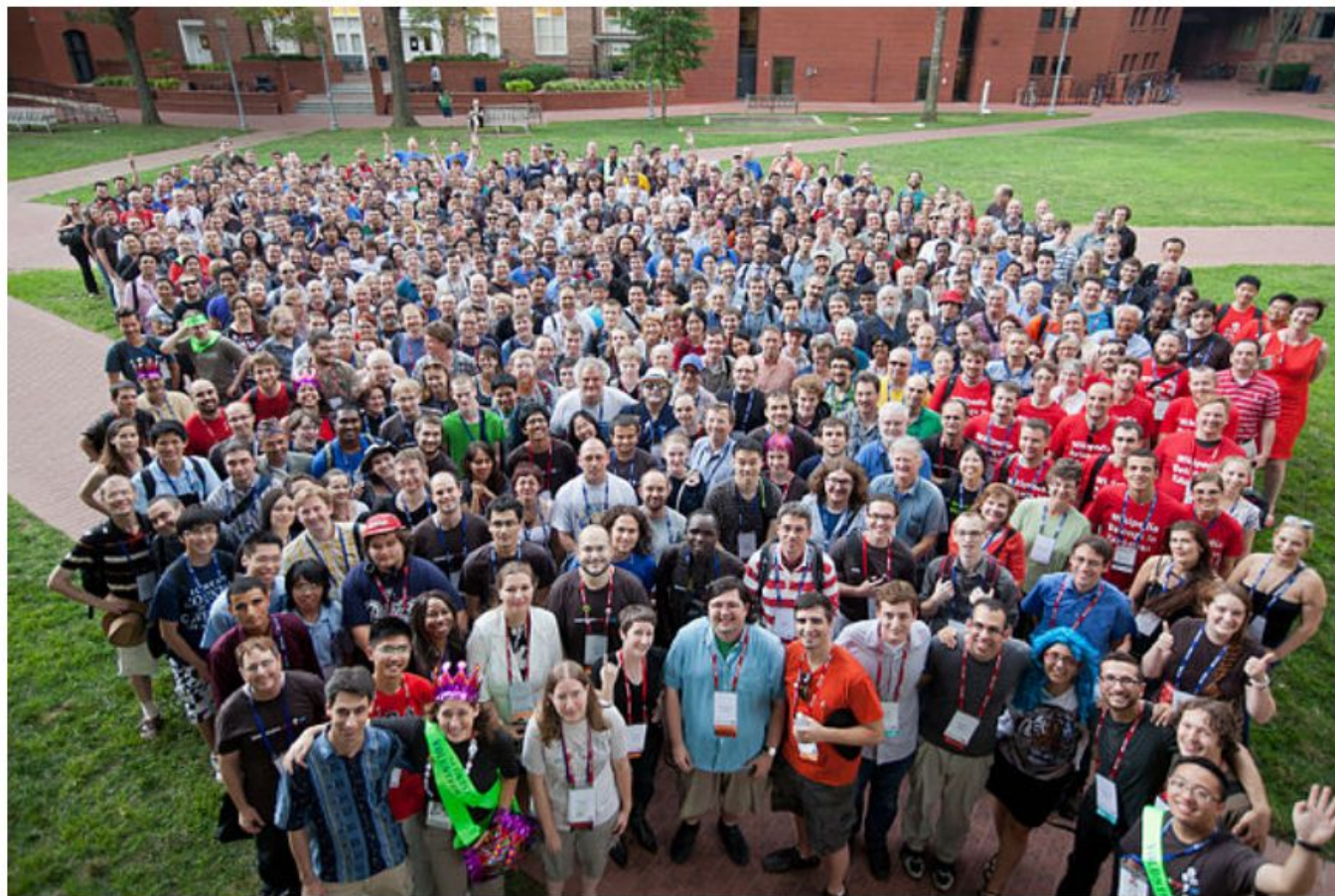
Вікімедійна спільнота: учасники й учасниці конференції Вікіманія 2012