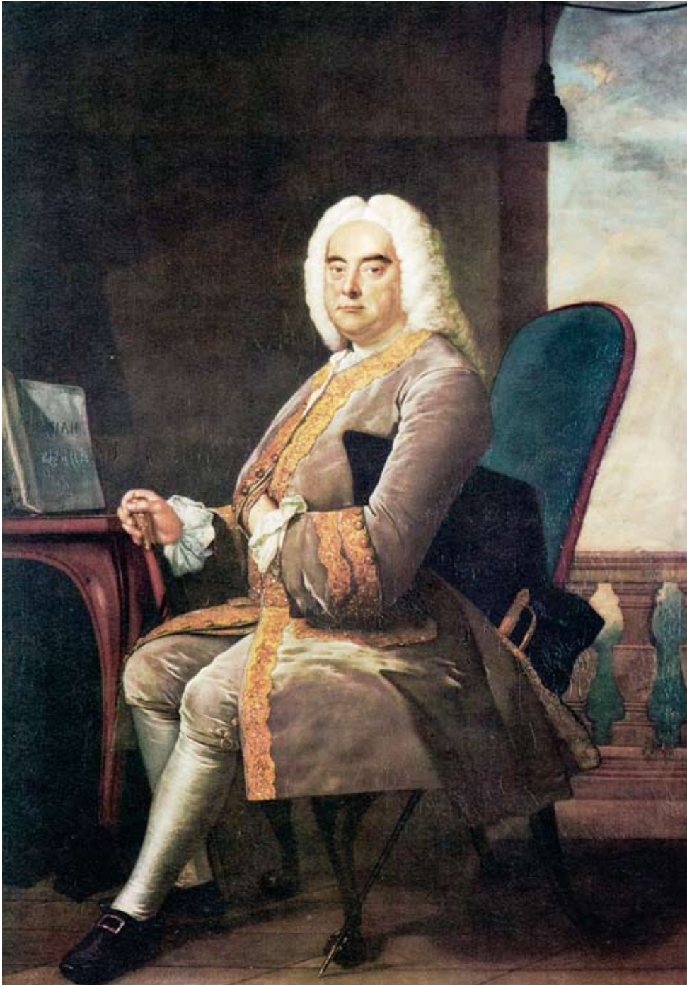
Portret van Georg Friedrich Händel door Thomas Hudson, 1756