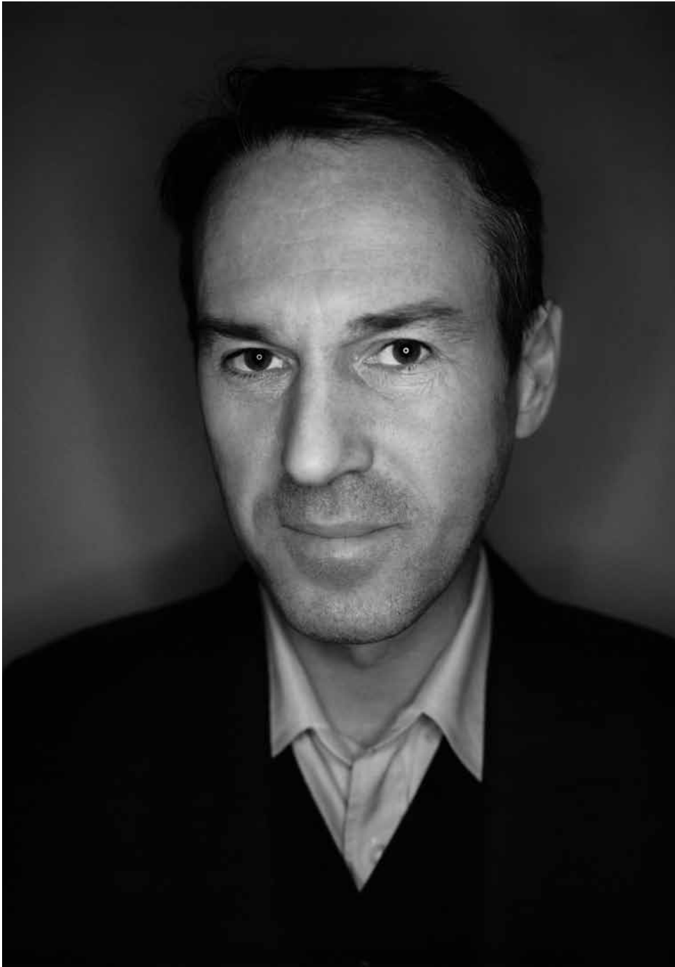
Ivo van Hove