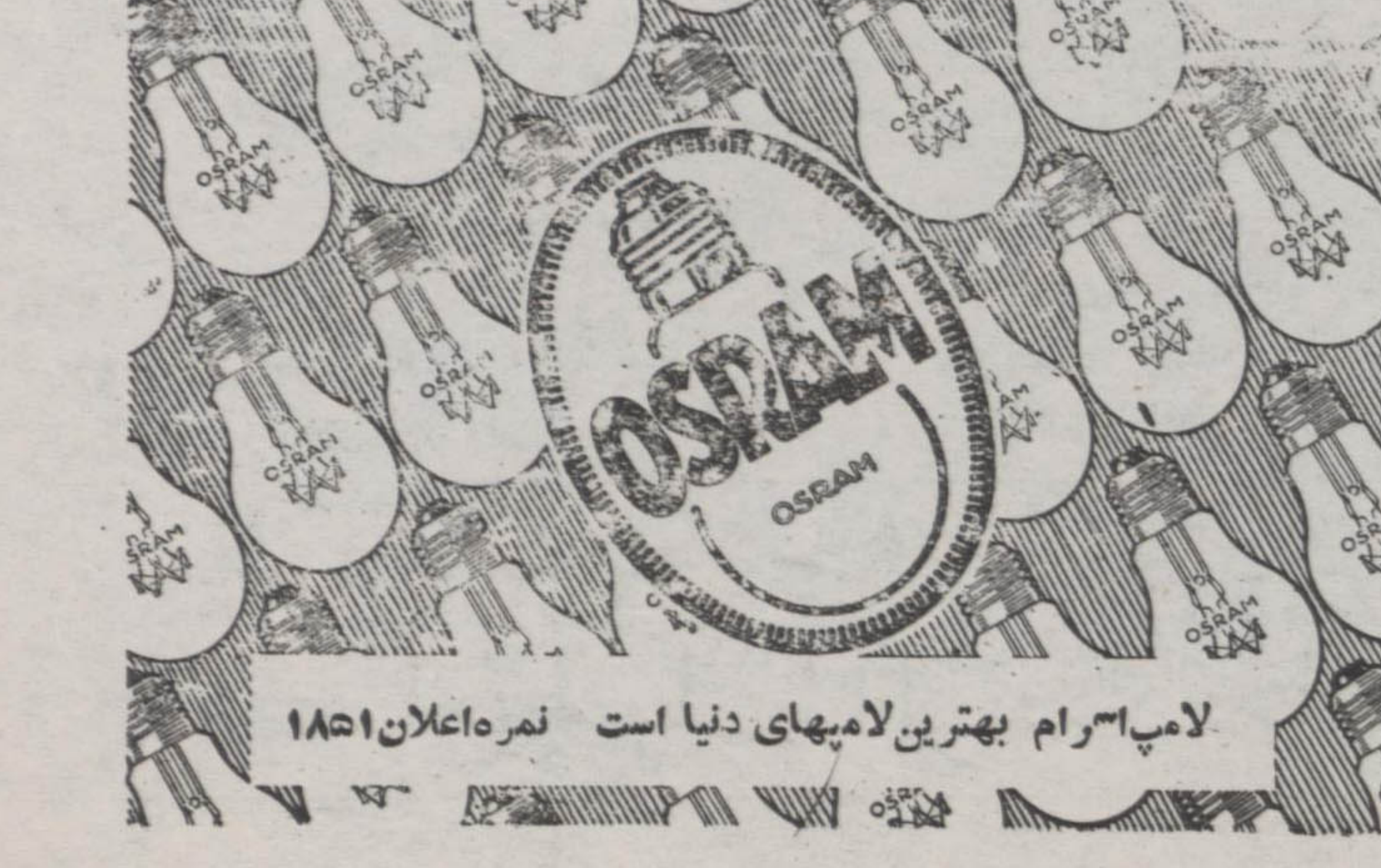
لامپ ۳۰ گرم بهترین لامپهای دنیا است - شماره اعلان ۱۸۵۱

نمبره اعلان ۲۰۲۶ رئیس ثبت اسناد و املاک طهران