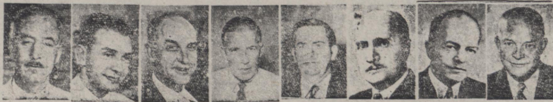
ایزنهاور - استامن - هندرسون - وارن - پال - کار - کیاردی - بارتن

یکی از آقایان وزیران امروز خبر نگار ما گفت پس از آنکه آقای هندرسون در جلسه دیشب هیئت دولت حضور یافت و متن پیام ریاست جمهوری را مبنی بر موافقت با پرداخت ۴۰ میلیون دلار بعنوان بقیه در صحنه چهارم