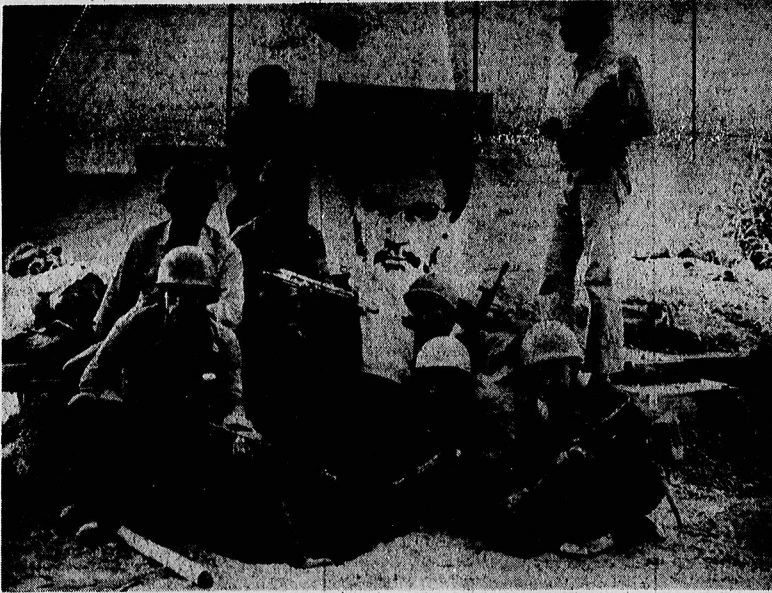
روشنک دهر ایرانی درجه‌های جنگ جنوب به ایداد اعلامی اسلام و شوقی استیضاح و تاج‌گذاری کشور و عزت‌بخش مبارزه میکنند، عکس از مرتضی‌خان