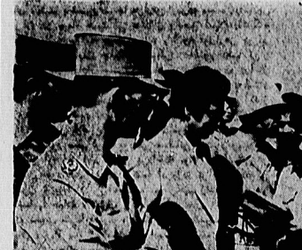
رئیس جمهوری در گفتگو با خبرنگاران در محل بازدید از خط آهن تهران - اهواز.

رو حیو ز مندگان ایرانی سیلعالی است. این موضوع در این بخش مورد بحث قرار گرفته است. سیل‌های عظیم در منطقه خلیج فارس و تنگه هرمز، خسارت‌های زیادی به مزارع و مناطق مسکونی در این منطقه وارد کرده است.