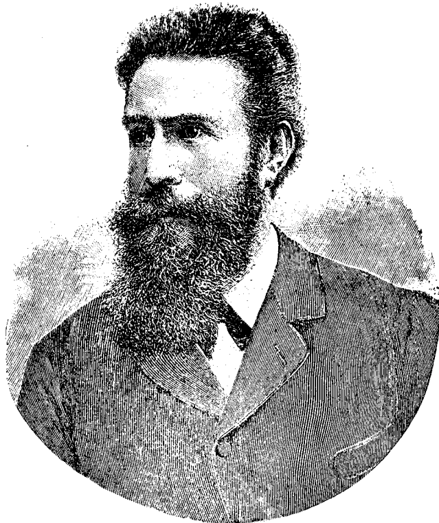
C. W. RÖNTGEN.

Și să ne aducem aminte că nu eră de loc ușor lucru într'o vreme „a face trei zile la domni“; cu tôte acestea amantul credincios, iubitor și plin de