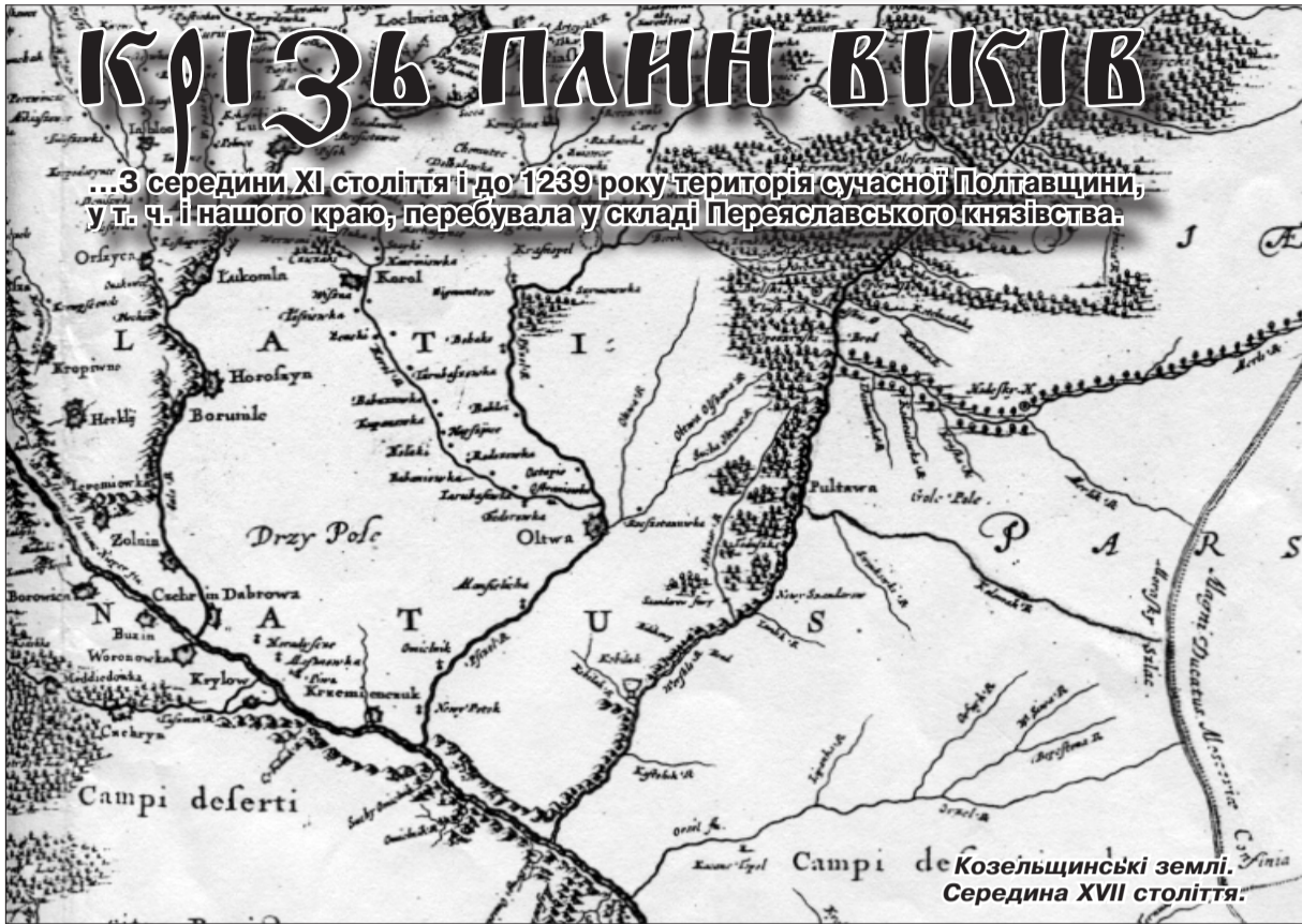
Козельщинські землі. Середина XVII століття.

...З середини XI століття і до 1239 року територія сучасної Полтавщини, у т. ч. і нашого краю, перебувала у складі Переяславського князівства.