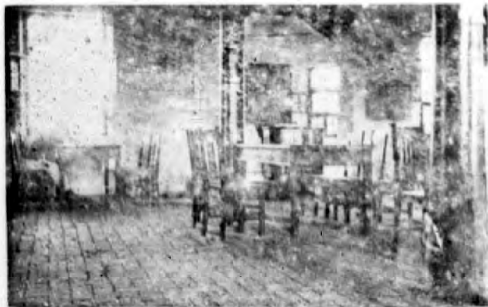
影攝部內室覽閱部書圖館本