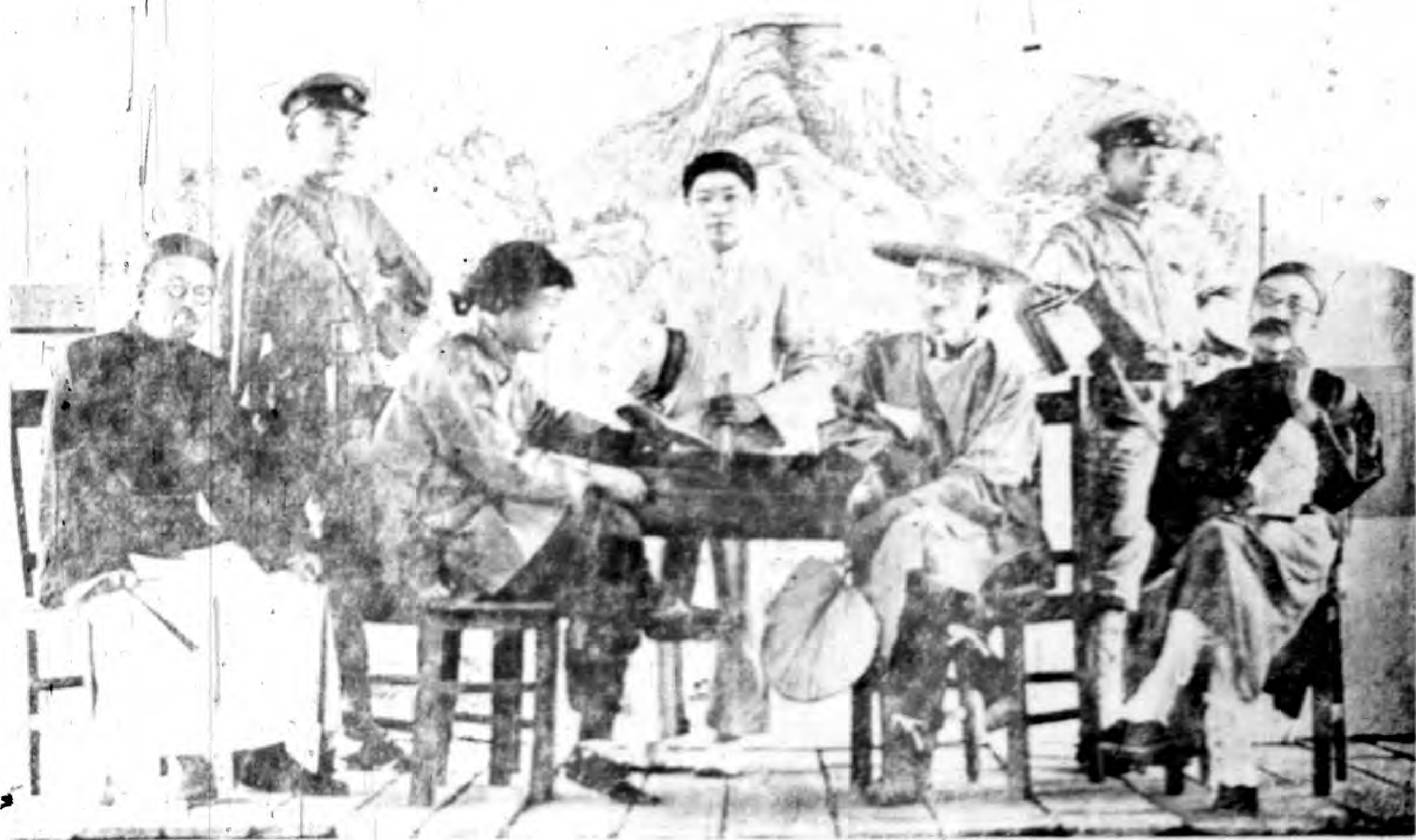
本館同人扮演睜眼瞎子新劇留影