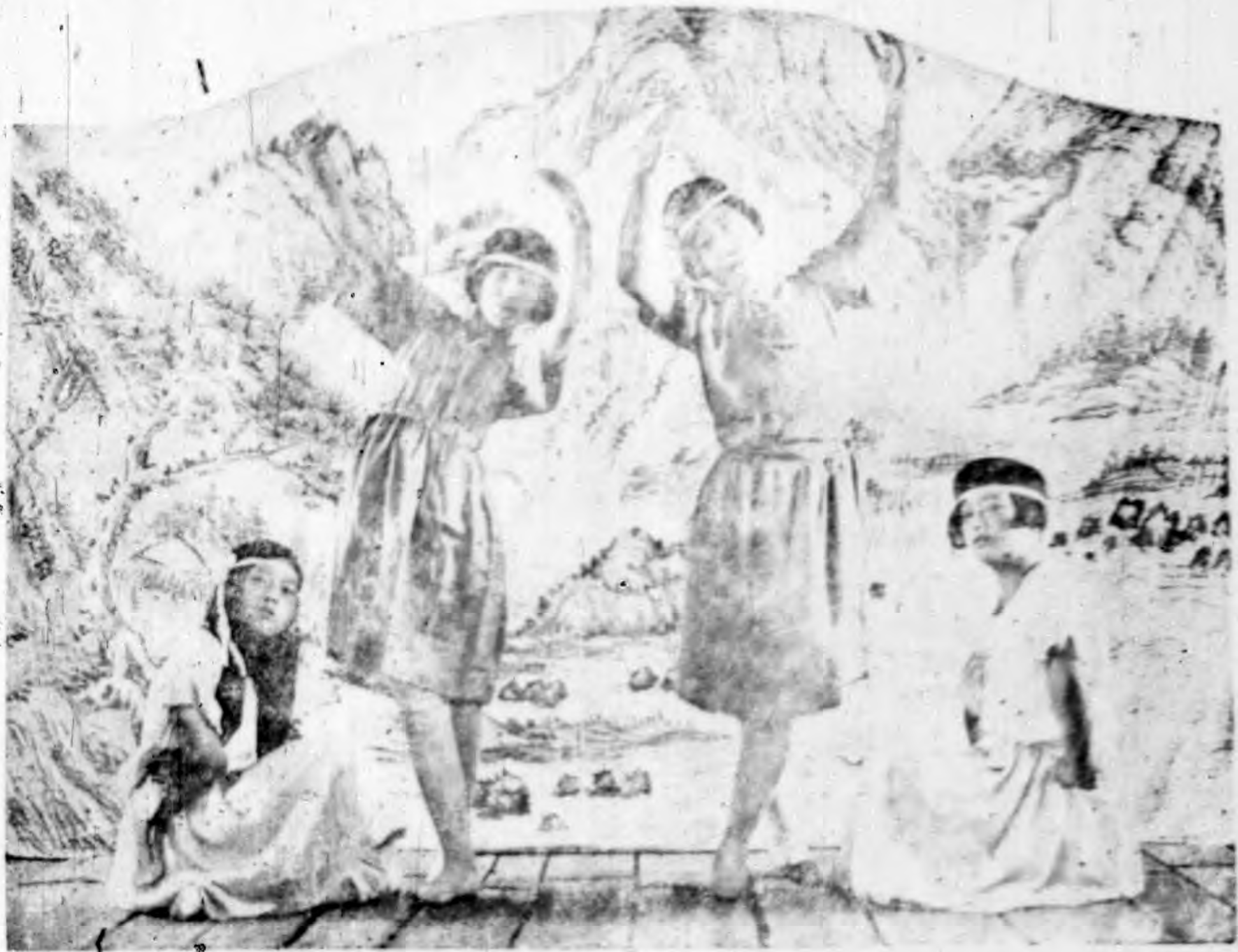
影留舞歌時業畢行舉生學校民館本