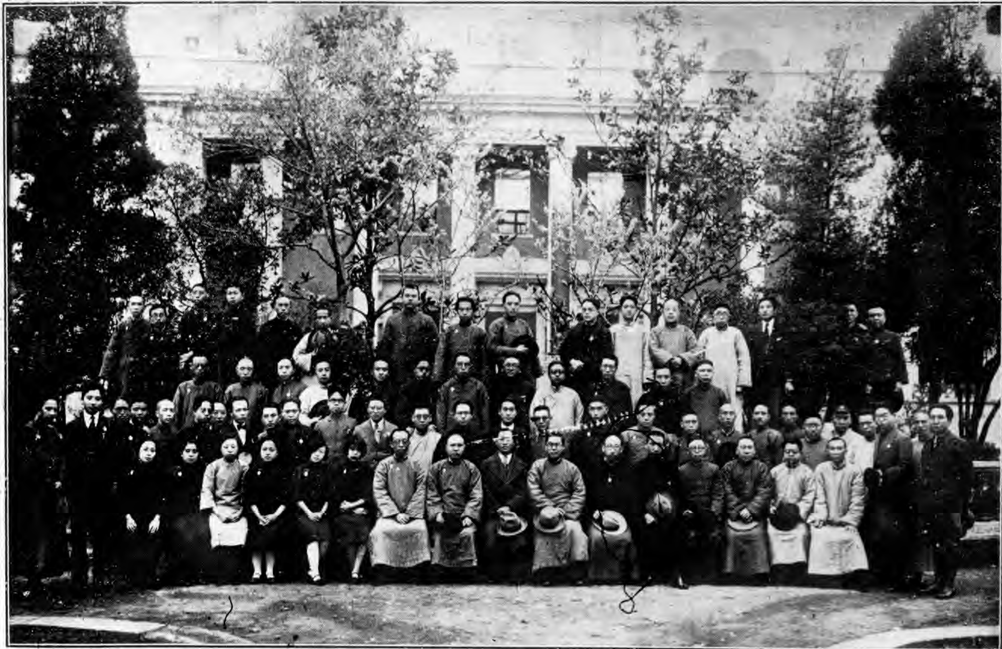
影攝體全員職員委會員委導指務黨省南湖 加參志同市養會員委察視央中