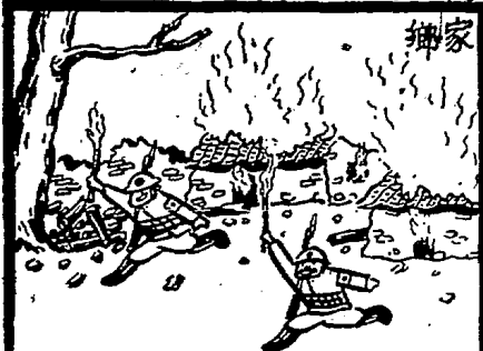
作早卜 ? 路注的們我

此句，祇要帶子就會像我們原來的一樣，萬眾一心，完好如初……」 到魔術者手裏，果然接續得完好如初了。人們驚奇地看著接續帶子的把戲，無形中得了一個「團結」的深刻印象。