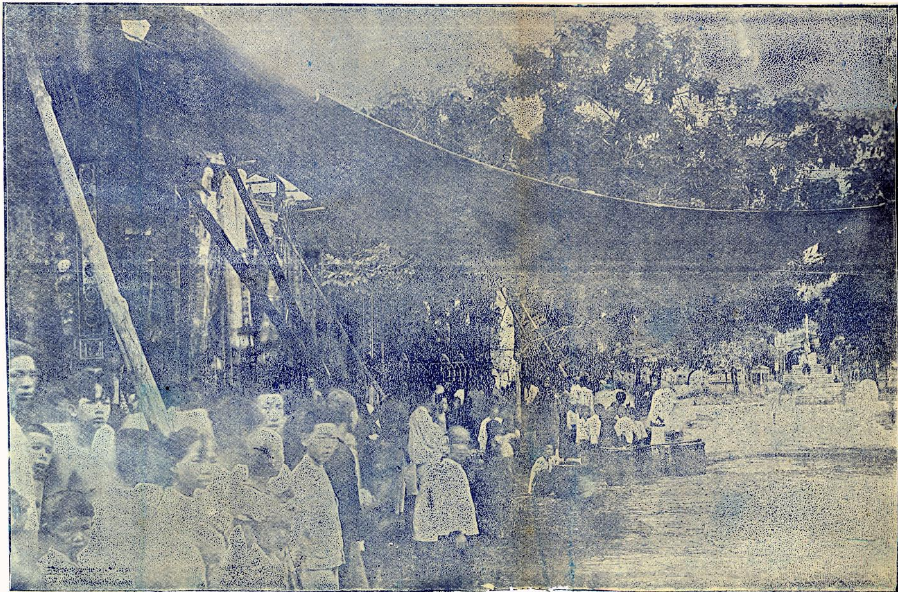
會 勝 蘭 孟 之 安 潮