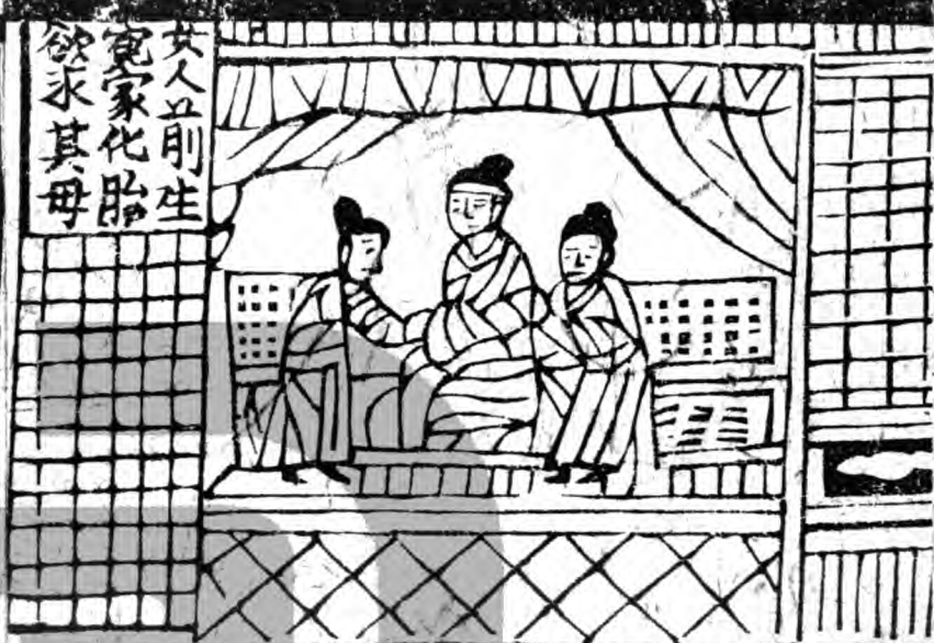
女人前生冤家化胎欲求其母