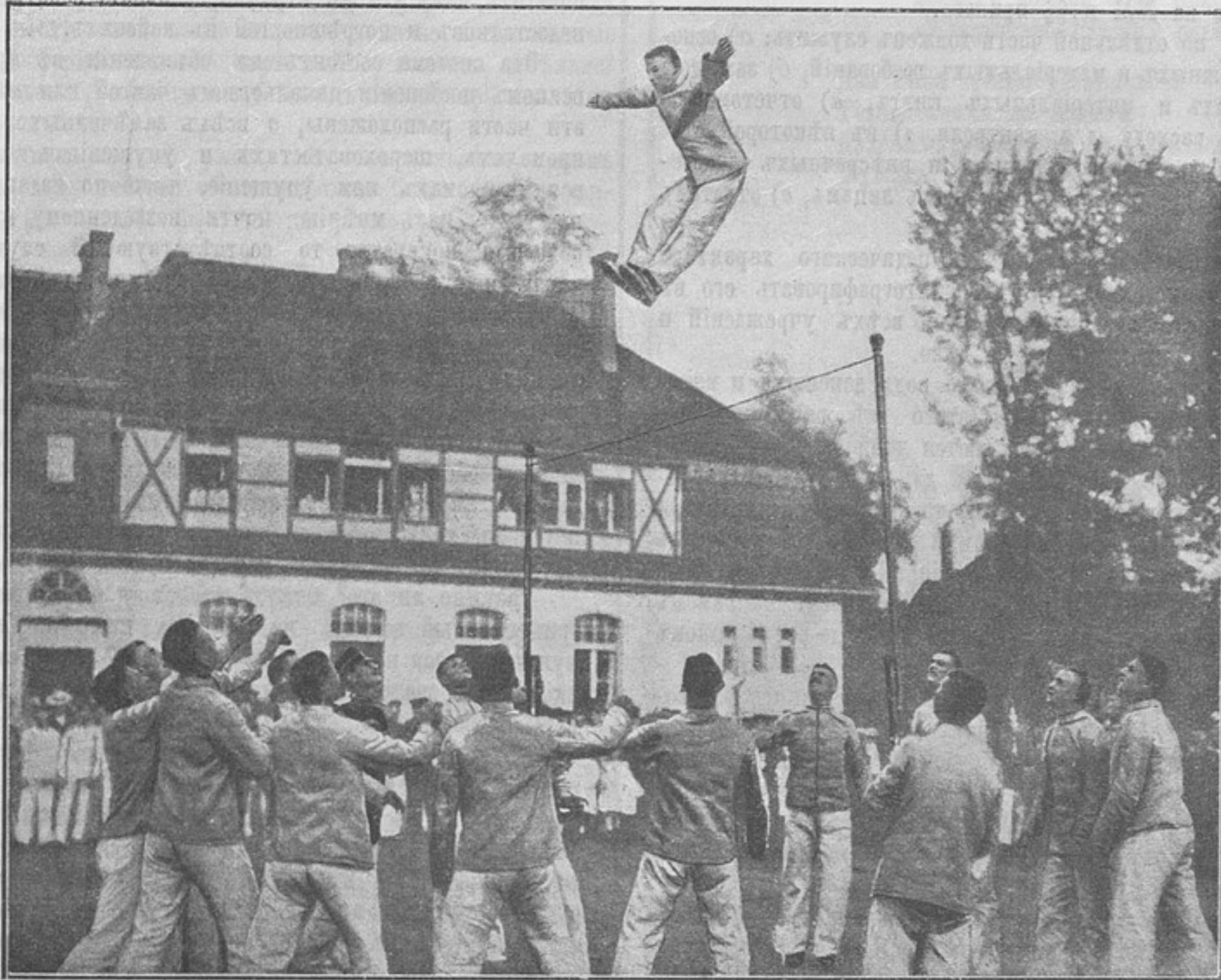
Гимнастика въ Потсдамской унт.-офицерск. школѣ въ Германіи. Прыжокъ вышиной въ 4 метра.

докъ. Опасаться же заноса такимъ путемъ въ корпусъ «освободительныхъ идей» не приходится, ибо отцы, коихъ дѣти воспитываются въ кадетскихъ корпусахъ, освободительныя идеи уже навѣрное не проповѣдуютъ.