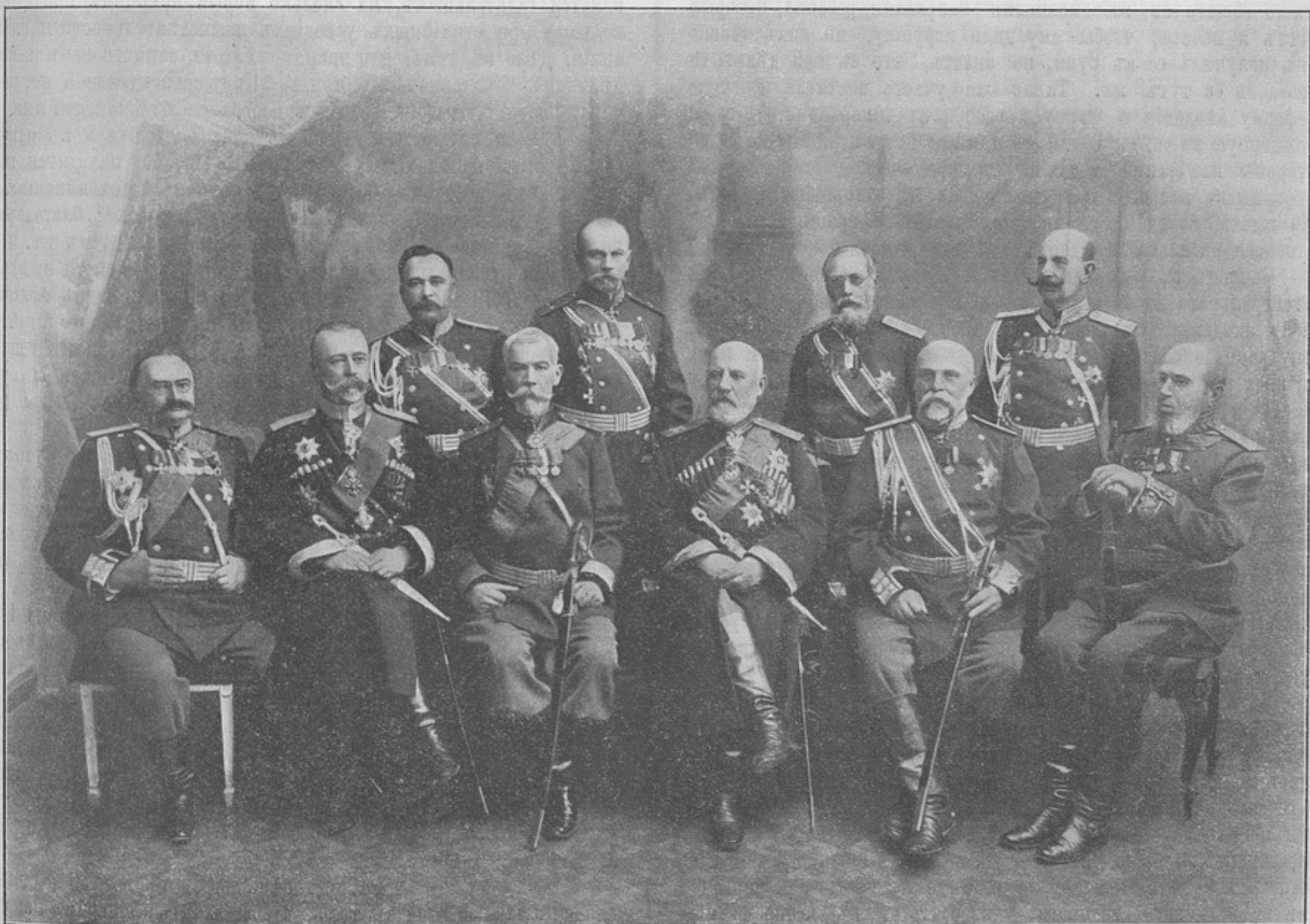
Командный составъ 1-го Кавказскаго армейскаго корпуса.

СОДЕРЖАНИЕ: С.-Петербургъ, 15-го сентября. — Распоряженія по военному вѣдомству. — Хроника. — Армейскія замѣтки И. Ночинъ . — Наши кадетскіе корпуса. Ө. Торклубъ . — Сокращеніе переписки и отчетности. И. М. Перликъ . — Отчего не наоборотъ? Б. Ушаковъ . — Квартирныя деньги, выдаваемые городскими управами. Тумскій . — Къ 209-й годовщинѣ 11-го пѣхотнаго Псковскаго генераль-фельдмаршала князя Кутузова Смоленскаго полка. И. Д. — Обзоръ печати. — Иностранная армія. — Фельетонъ. — Объявленія. — Высочайшіе приказы.