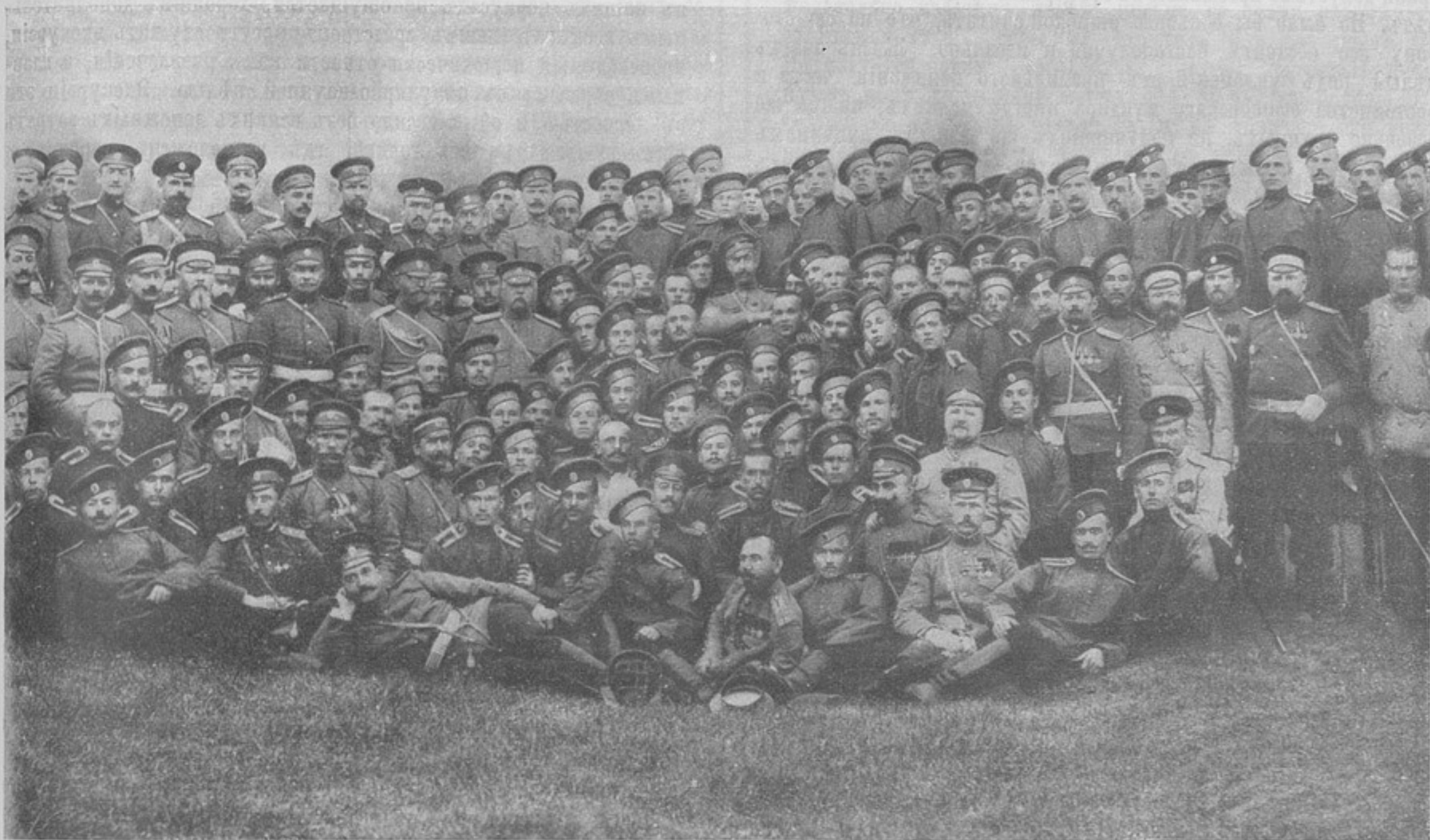
Е. И. В. Великій Князь

Достигнуто это будетъ преобразованиемъ и расширеніемъ компетенціи суда чести — такъ впредь будетъ называться институтъ, извѣстный донинѣ подъ именемъ суда общества офицеровъ.