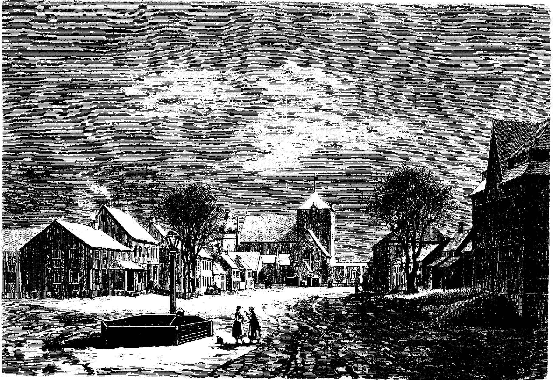
Parti af Munksgaden i Thronhjelm med det Huus, hvor Tordenskjold blev født.

og Tordenskjold maatte endogsaa lide den Tort, at see sin Gavn hos Kongen svækket og blive reduceret fra Eskadreforsker til Skibsforsker. Hans Flag vaiede dette Aar og senere paa „Laaland“, men denne Fregat forled han en kort Tid for at reise til Kjøbenhavn og faae sit Forhold undersøgt; en Krigsret blev nedsat, men denne fritjendte ham for al Skyld i de flere