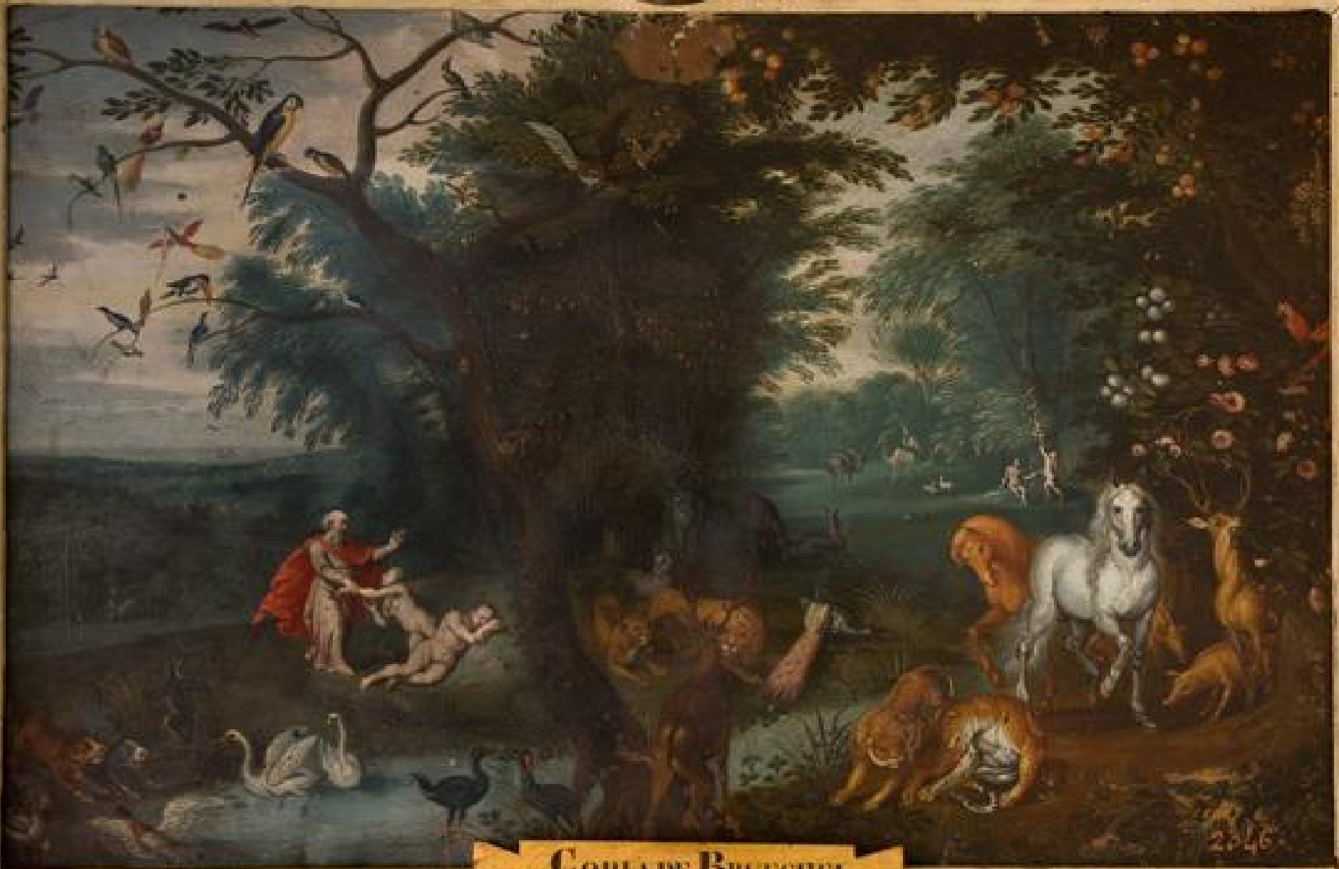
COPIA DE BRUEGHEL EL PARAISO TERRENAL LA CREACION DE EVA.