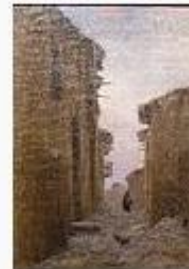
Modest Urgell i Inglad... 86.075 octets