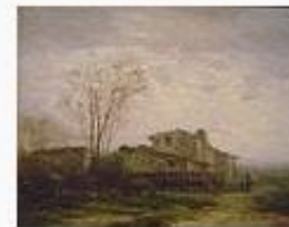
Modest Urgell i Inglad... 101.682 octets