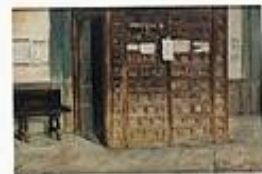
Marià Fortuny i Marsa... 88.026 octets