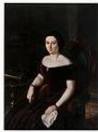
Joaquim Espalter i Rul... 52.201 octets