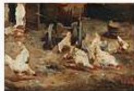
Marià Fortuny i Marsa... 31.785 octets