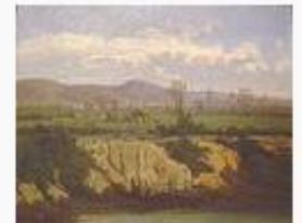
Lluís Rigalt i Farrion... 108.030 octets