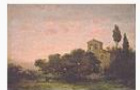
Modest Urgell i Inglad... 83.181 octets