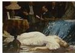
José Garnelo i Alda- ... 90.436 octets