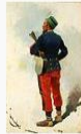
Josep Cusachs i Cusach... 112.596 octets