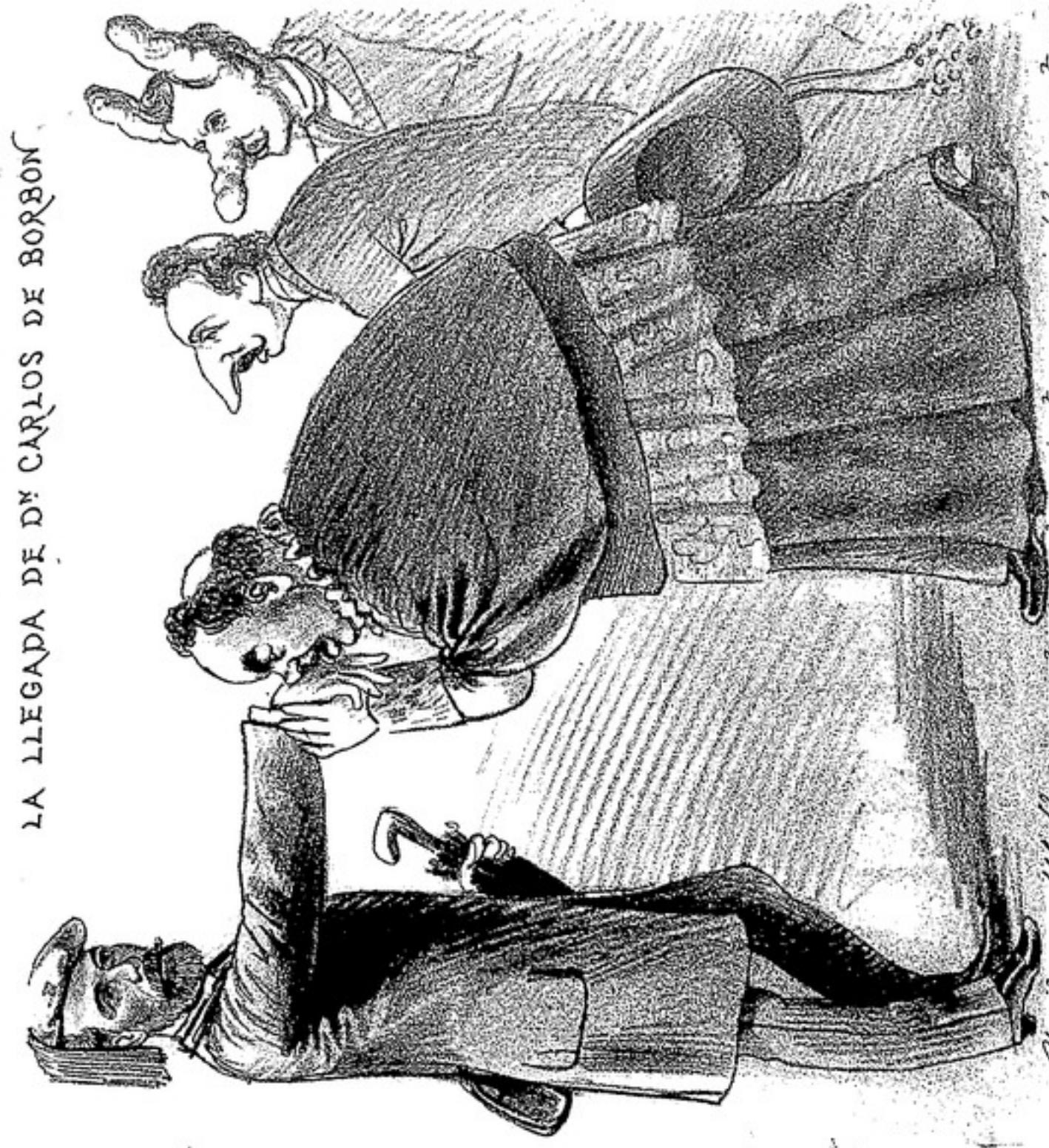
LA LLEGADA DE D. CARLOS DE BORBON