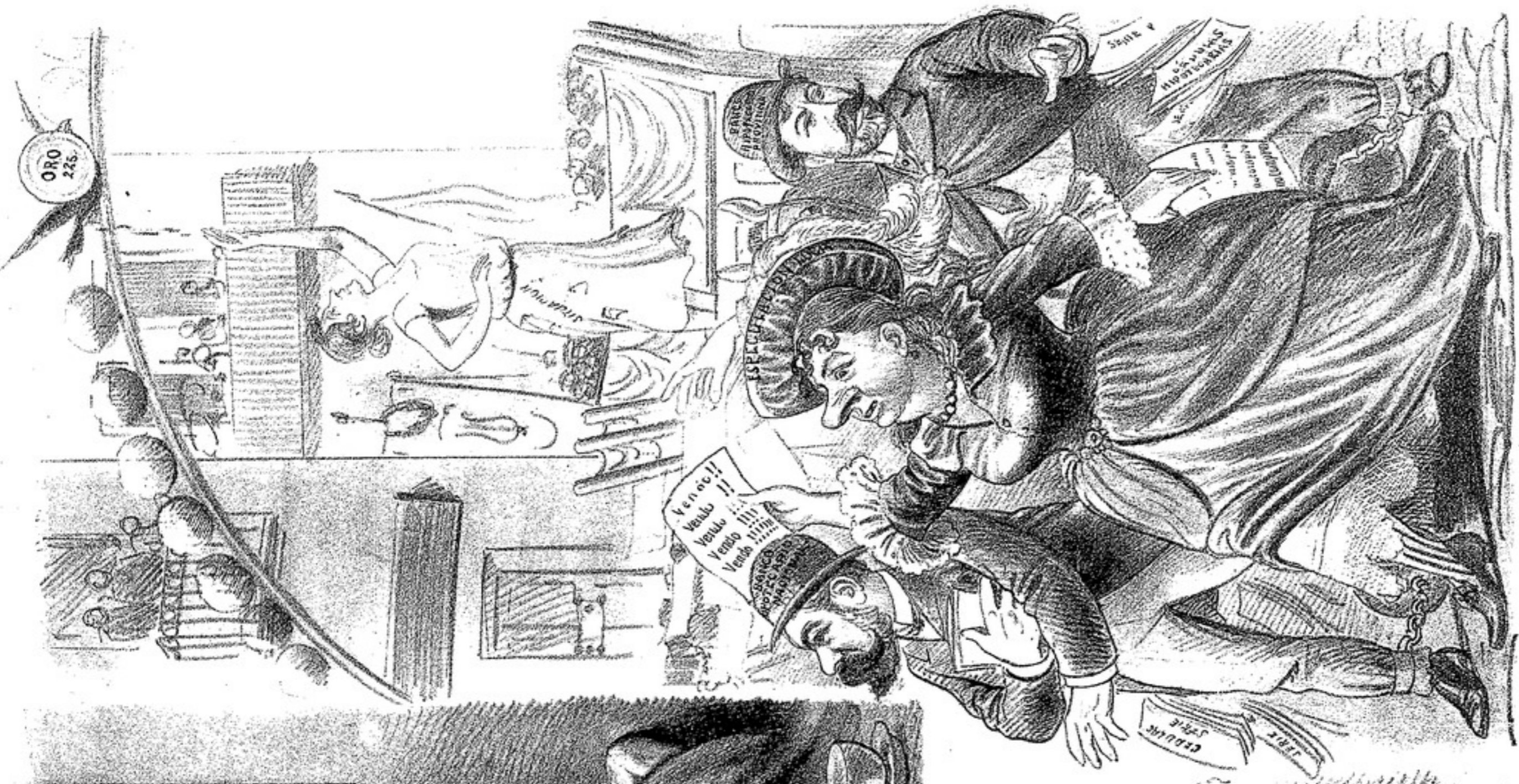
LA COMPARSA DE ACTUALIDAD La Situacion y sus autores.