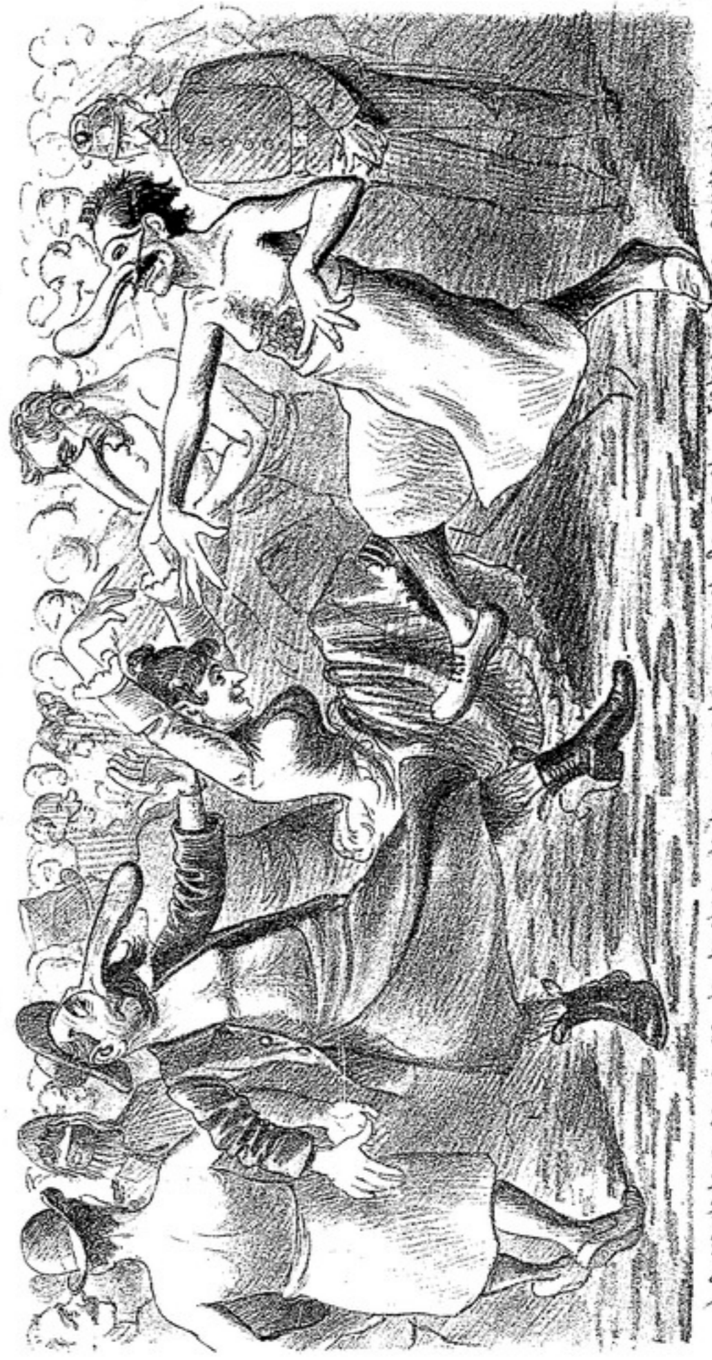
La verdadera causa de la lujuria de los paroleros es el Carnaval - Estos pobres condenados a trece por de noche, no podrian asistir a los esplendidos bailes del Politrama.