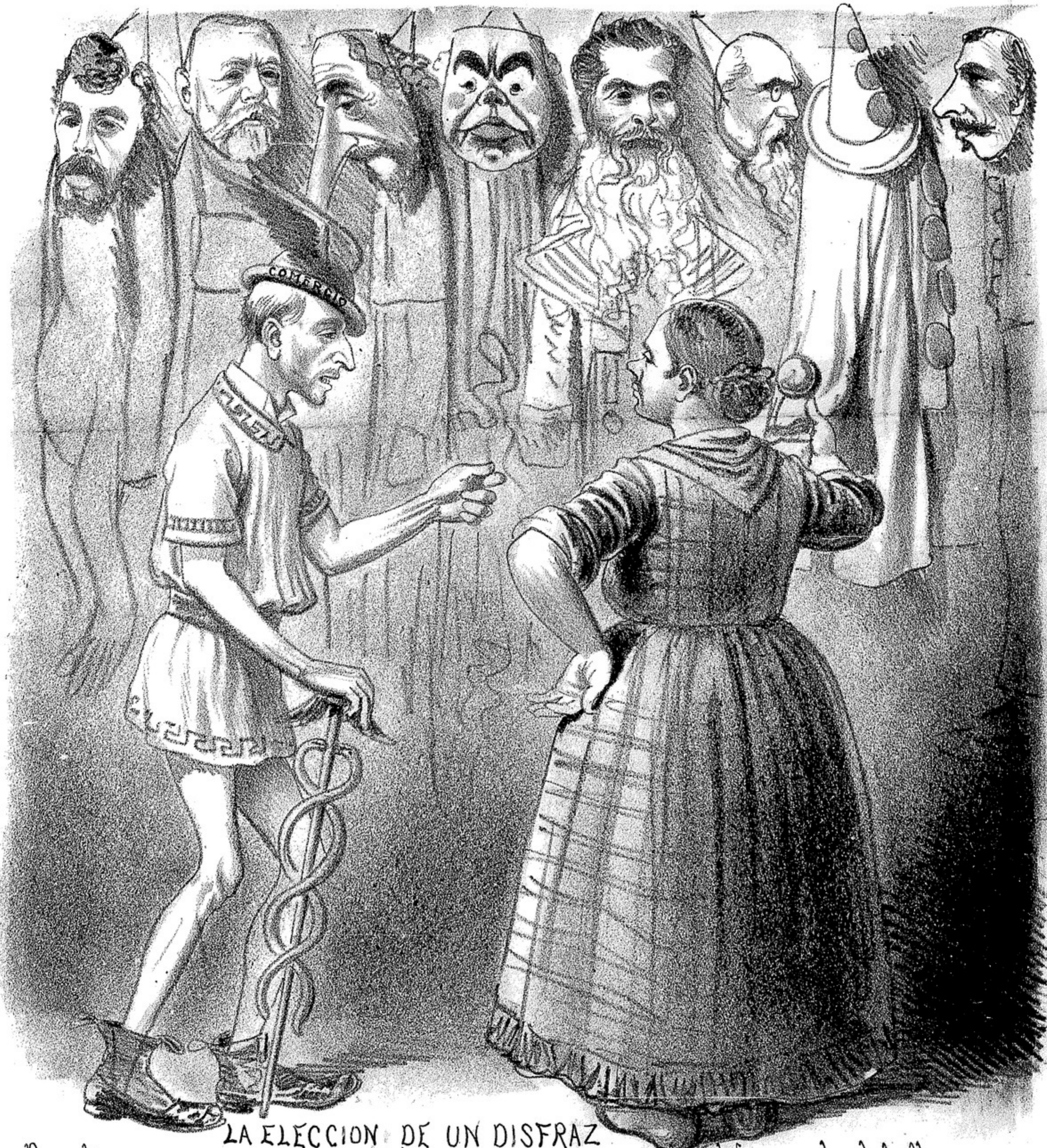
LA ELECCION DE UN DISFRAZ

Para 1890 la prima consiste en cuatro retratos en cartulina de ilustres argentinos.