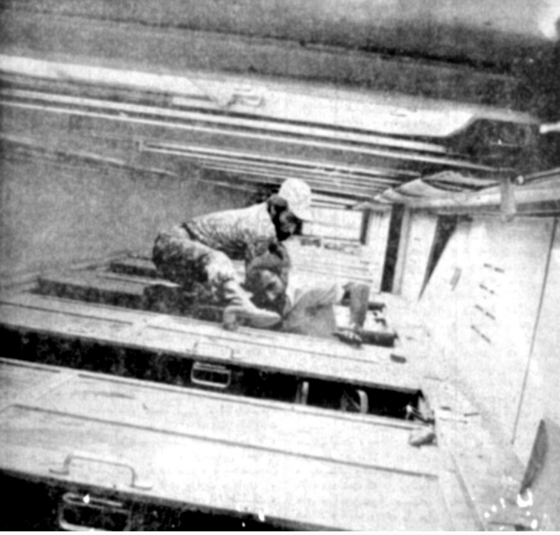
بعضی از واگنهای چنان درهم پیچیده شده است که پاسداران با زحمت موفق به بیرون کشیدن مجروحین می شدند

افشاگری دادستان انقلاب خوزستان در مورد گروه چهارشنبه سیاه • گروه چهارشنبه سیاه هدف تجزیه طلبی دارد • اکثر افراد این گروه از خارج دستور میگیرند در صفحه ۲