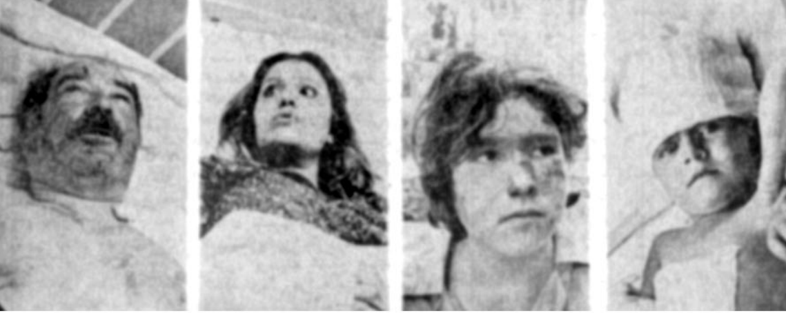
۴ تن از مجروحین حادثه قطار تهران - مشهد