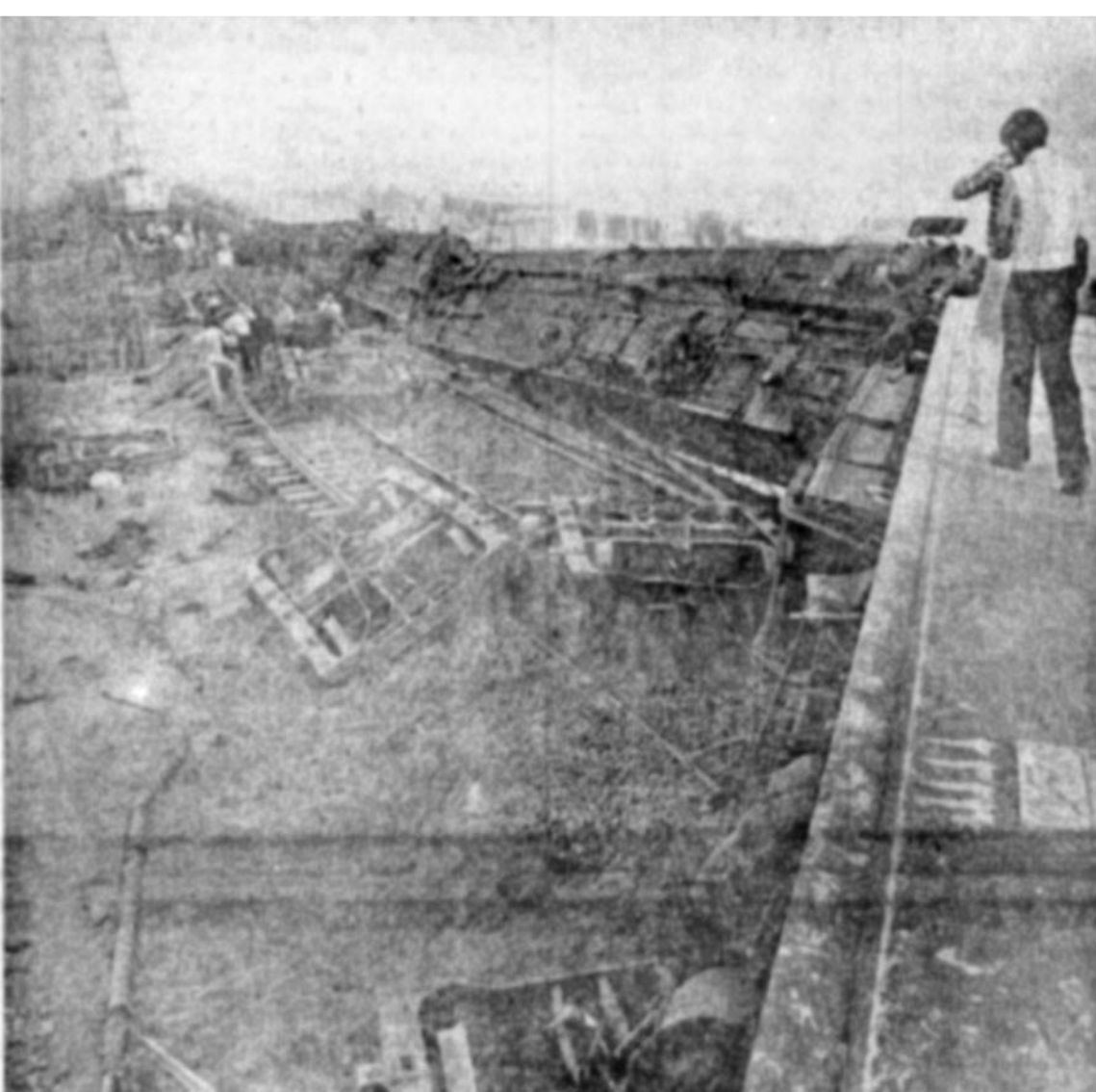
حادثه قطار تهران - مشهد یکی از شدیدترین سوانح راه آهن در ایران بود. این عکس نشان دهنده این واقعت است

طبق آخرین آمار، کشته شدگان ۱۰ نفر و مجروحین ۷۰ نفر هستند