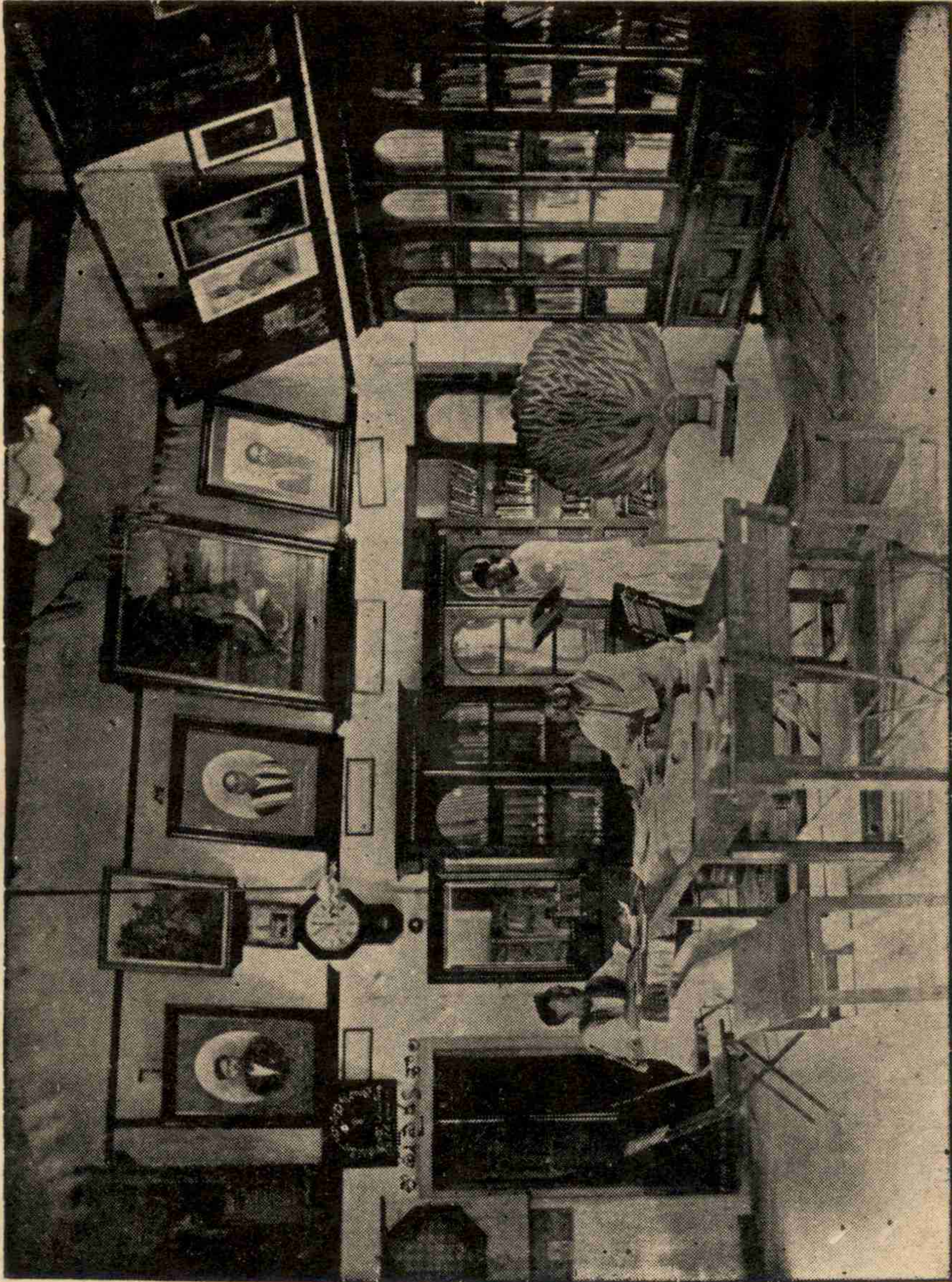
శ్రీ ప్రజురాంజూ మల్లేశ్వరాంధ్ర గంధాలయము, (అంతర్భాగము).