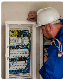
CAN Europe, 2017