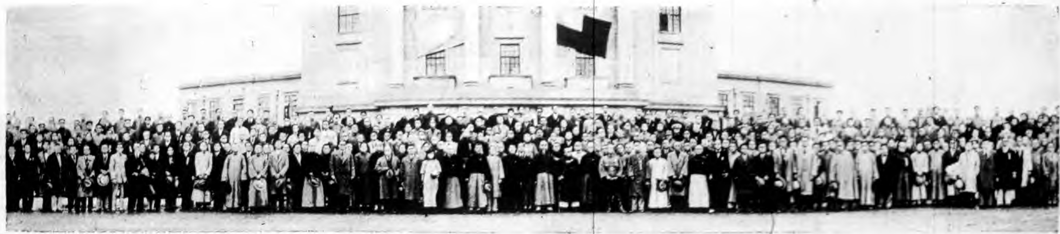
中國國民黨第四次全國代表大會（一）開幕式