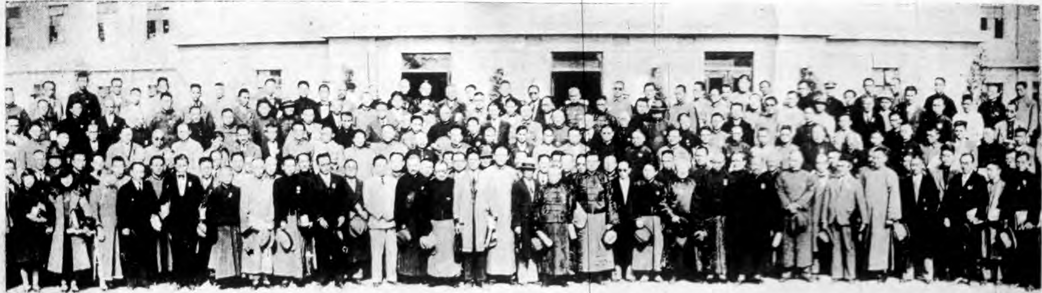
(二) 閉 幕 式