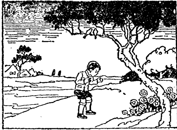
之版出局本見均圖插與材教 注附 中册二第本讀語國小高準標程課新