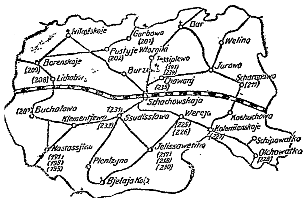
圖 二 第

有些農業者對於每一個地方用一本特別的書記錄出來，即對於每一個居住地有一種日常的計算。