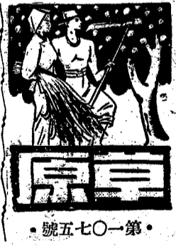
灰色的靈魂 無名氏

灰色的靈魂 無名氏 在一個灰暗的早晨，我獨自走在荒涼的小徑上。四周是死寂的，只有幾聲鴉兒的啼叫，劃破這沉重的空氣。我想起那雙灰色的眼睛，那雙曾經在深夜中閃爍過光芒的眼睛。