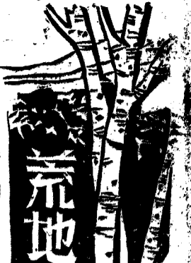
國立湖南大學荒地社主編