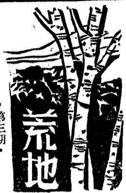
荒地 第三期 國立湖南大學荒地社主編