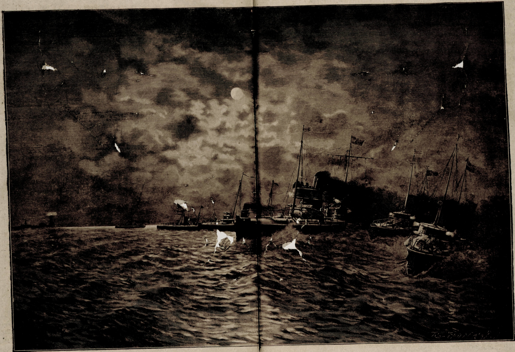
آمریقا اسپانیا بحارہسی — طور پیدو ہجومی