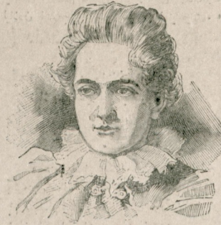
آمریقا حکومتنه اغانه حریبه اولهرق یوزبیک دولار یعنی تقریباً یکری بنش بیک ایرا اهدا ایدن برجدید اغنیاسندن میس غولده

یتاری بلیغدر : بر ویرانه دن بر فریاد چیقوق قاجع ، مؤثر برحال . برخرابه زارک زمیننده ، برنالارک ایننده البته طوقوناقلی برشعل مندیجدر . فقط « بواجع شی بی متأثر ایستی » . سوزی شعر اولماز .