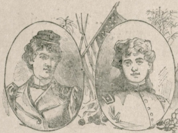
یوزباشی ویتنتون آمریقادا عماریه حاشره می قادیرلادی حیات جتتورانه می تزیید انیش اولمغه بلاده کوسرلدی اوزره عرفانی تقدماً مجال حسیه اعطا المکرای کی بعضی یزیدت افای خدتمدی طالب اولشاردر . یوزلردن « نهی » اسمندکی قادی میرالای اوله ق برآییه و ویتنتون ایه اوچی میلس الیه یوزباشی تعیین اولمشدر .

میرالای نلی « برخرابه زارده مسافر قالانک مست مدام وخراب اولمانی استغراب اتملیدر . » سوزی وزن ، قافیه شعر ایده من . معلم ناجی افندی مر حومک بومشهور غزلنده : هواده یازغاه دوندردی روزکار بی خزانه منظم عمرمک بهارنده .