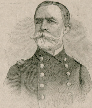
[ آمریکا دوتالری قوماندانی آمرال سامپسون ] Amiral Sampson.

ایچون توجه ایش ، یاخود کم بیلر نه‌عادی بر احتمال ایله دونمشدی . صورکه او یونی ، قایک یاندن یچرکن هرکه عطف ایدلسی طیبی اولان نظارلی بر مقدمهٔ انفات ظن ایش ، یونکه آلداتمش ، منتظم حیات مساعینی ، ناکهانی وقعه‌لره ملو بر سرگذشت مأمول ایچون فدایه قالیشمش ، شواکجه غاللانده طولاشق تصورلنده بولونمه باشلامدی . بو کولوخ دگیلدی ؟ فقط ایچون کولوخ اولسون ؟ اونک او یابغین کوزلرده نظرهٔ انفات آراغمه نه دن حق اولماسین ؟ بو علوی وجودلرک نازک قلبلی یالکز ایشز ، کوچیز ، مساعدهٔ تولده مظهر ، بجلا صاندالی ، اوچ چیفته قایل بکار ایچونی خلجانه کله‌جکدی ؟ بو عبتلر بالکنز امتیازلی بر زمرهٔ قلیله‌یی منحصر بولونه‌جقدی ؟ بو عالزلرک ایدی حظلر وعد ایدن شو سرگذشتلرندن فراغت ایددیرک نانکور برسی