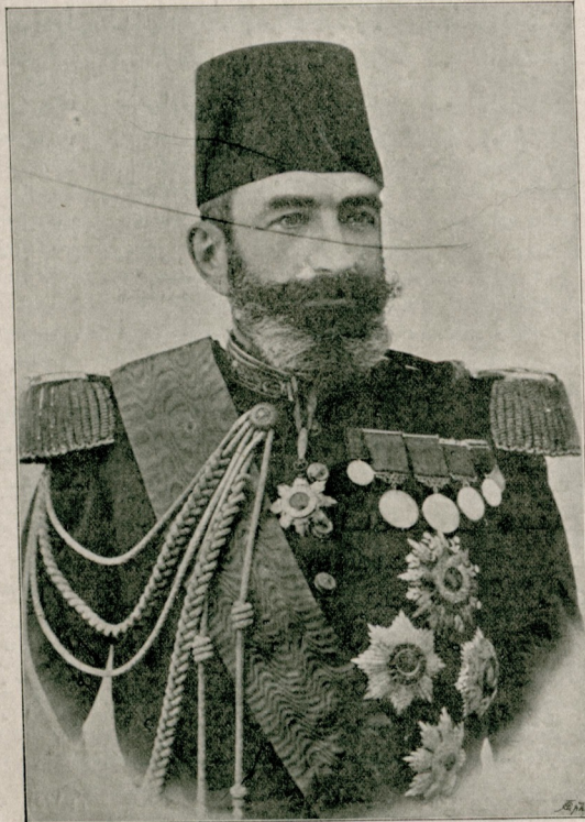
[ مشیر دولتو ادھم پاشا حضرت تارینک صوک تصویر لری ]

Son Excellence Maréchal Edhèm Pacha, d'après une photographie toute récente.