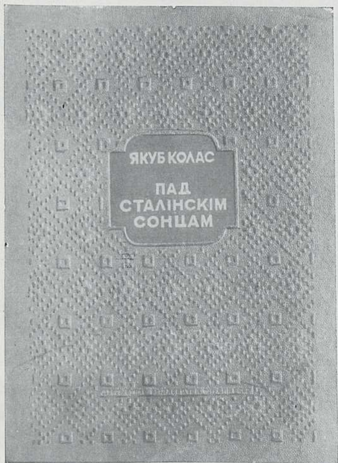
Вокладка зборніка вершаў «Пад Сталінскім сонцам». 1940 г.