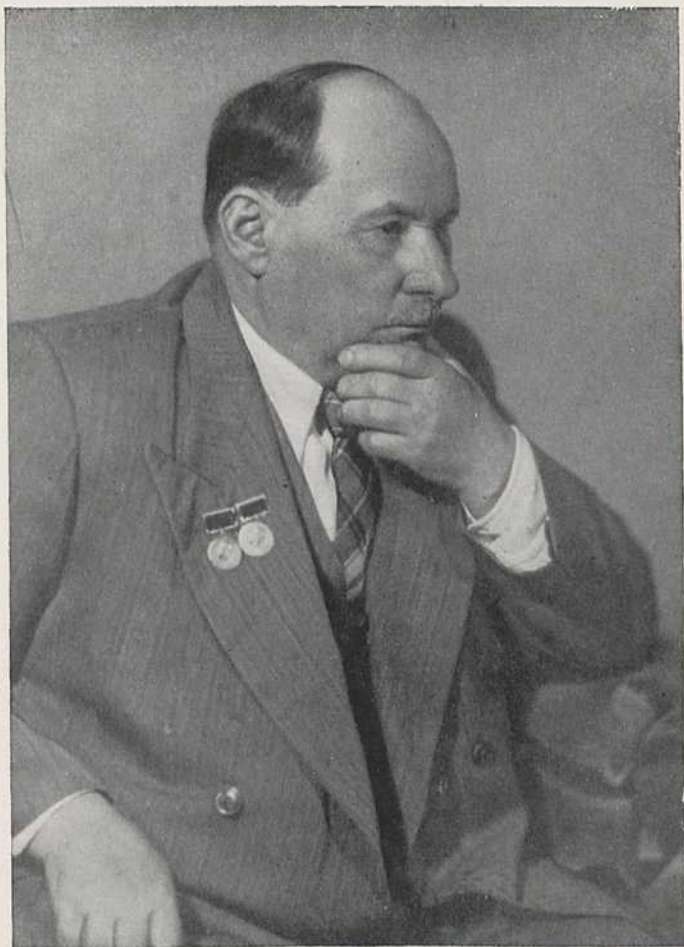
Якуб Колас. 1952 г.