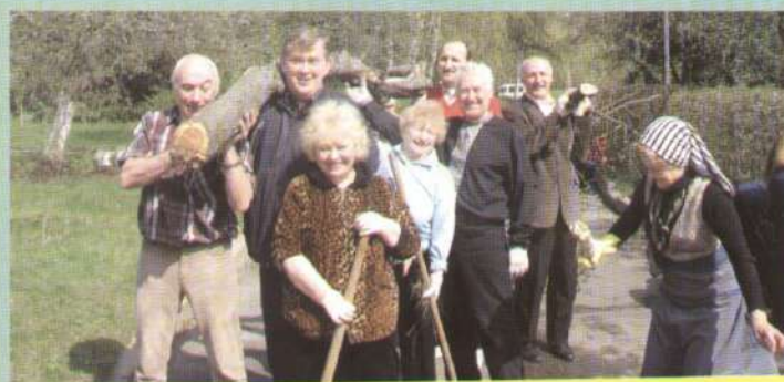
На день довілля, який проводився по всій Україні, наше земляцтво в черговий раз зібралось на прибирання території навколо чернігівського будинку із села Калюжинці Срібнянського району, що представлений у Музеї народної архітектури та побуту.