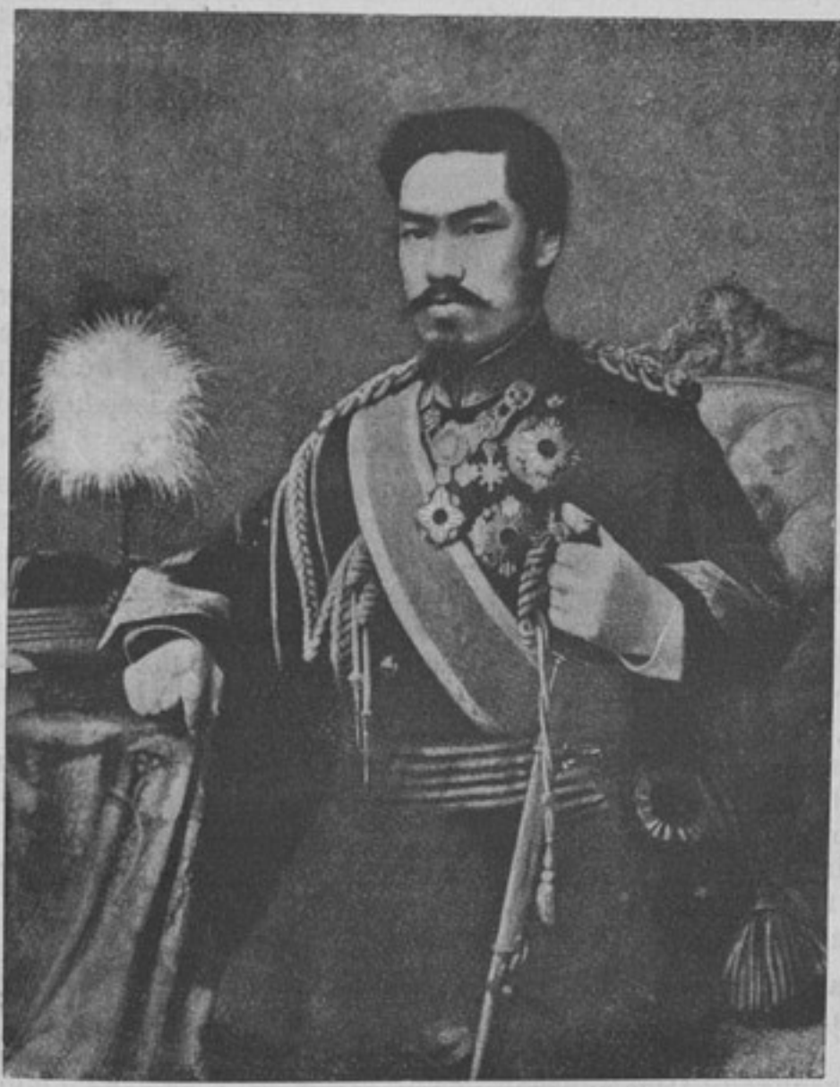
Императоръ Японскій МУЦУХИТО.