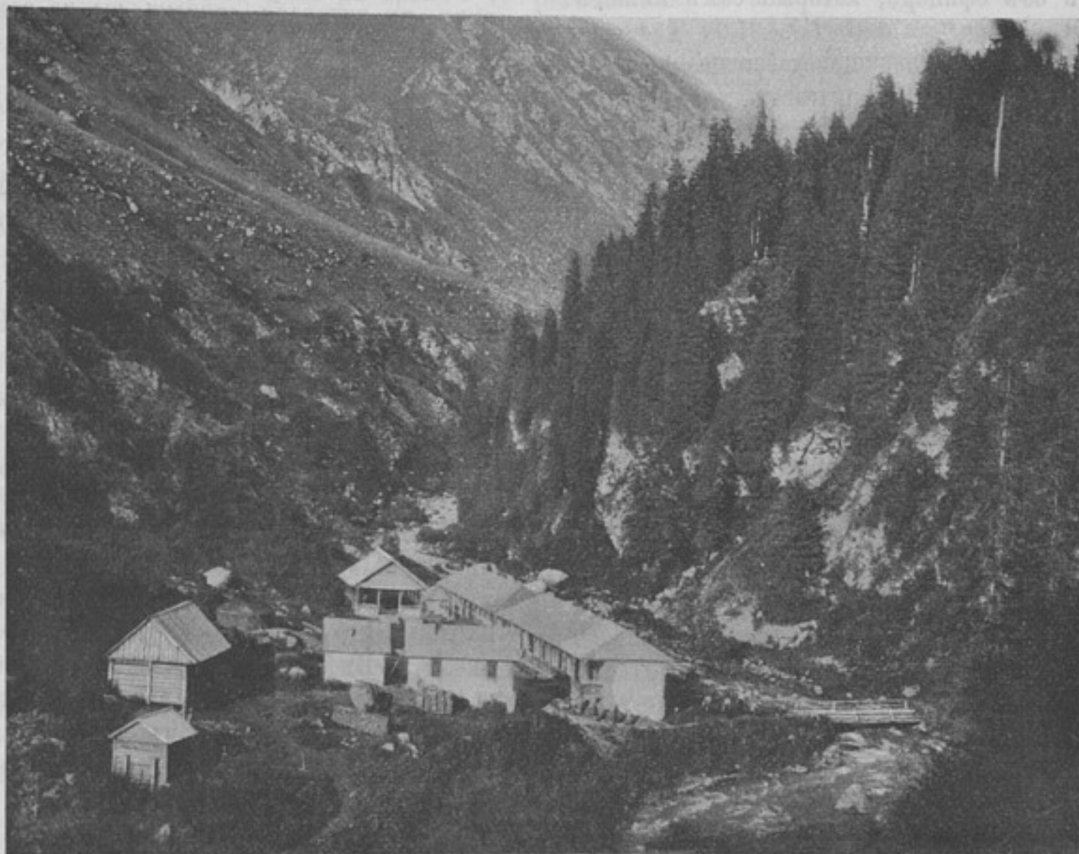
Аксуйскія минеральныя воды (къ ст. «Минеральныя воды Семирѣченской области»).

Устройство санитарныхъ станціи на Аксуйскихъ ключахъ и Джиты-Огузскомъ ущельи особенно благоприятно въ томъ отношеніи, что послѣ леченія горячими ваннами, больные могутъ пользоваться озерными купаньями и климатическимъ лѣченіемъ, такъ какъ долина Иссыкъ-Куля безспорно обла-