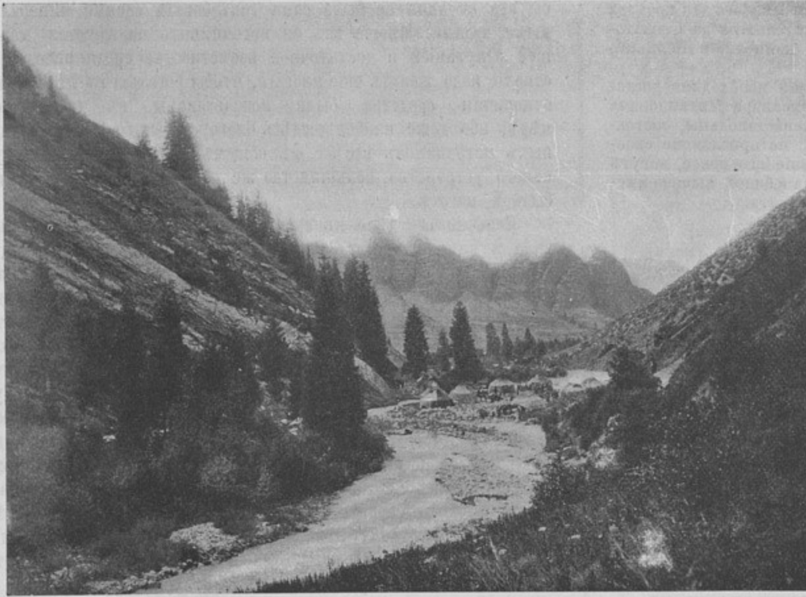
Джиты-Огузское ущелье (къ ст. «Минеральныя воды Семирѣченской области»).

Иссыгатинскіе минеральные источники въ 70 верстахъ отъ уѣзднаго города Пишпека, въ 40 верстахъ по хорошо раз-