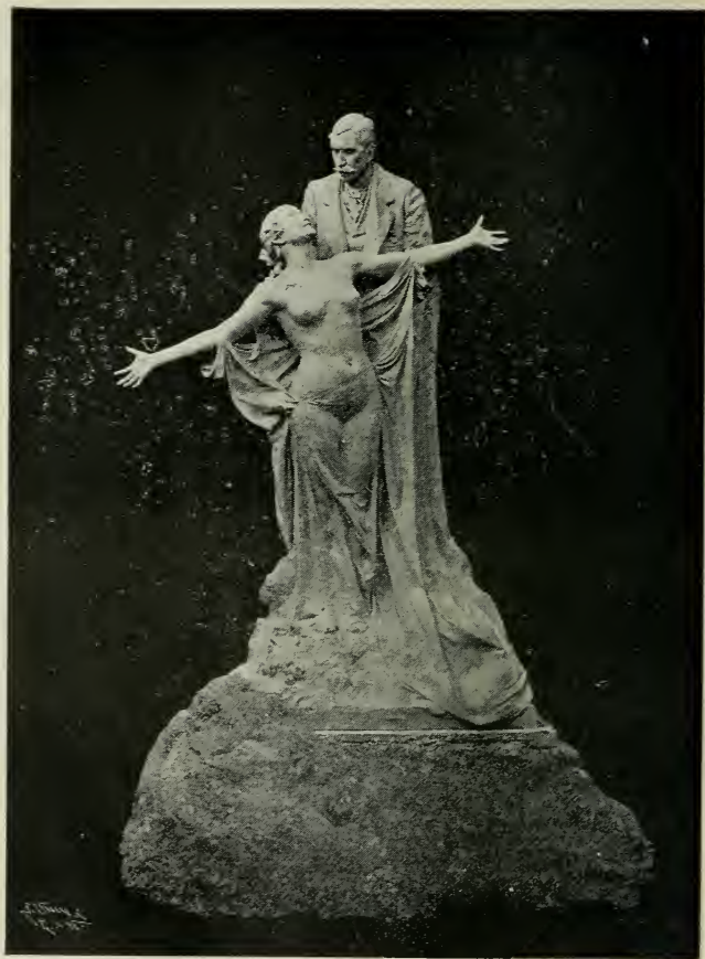
Monumento erigido a Eça de Queiroz

Obra do eminente escultor Teixeira Lopes