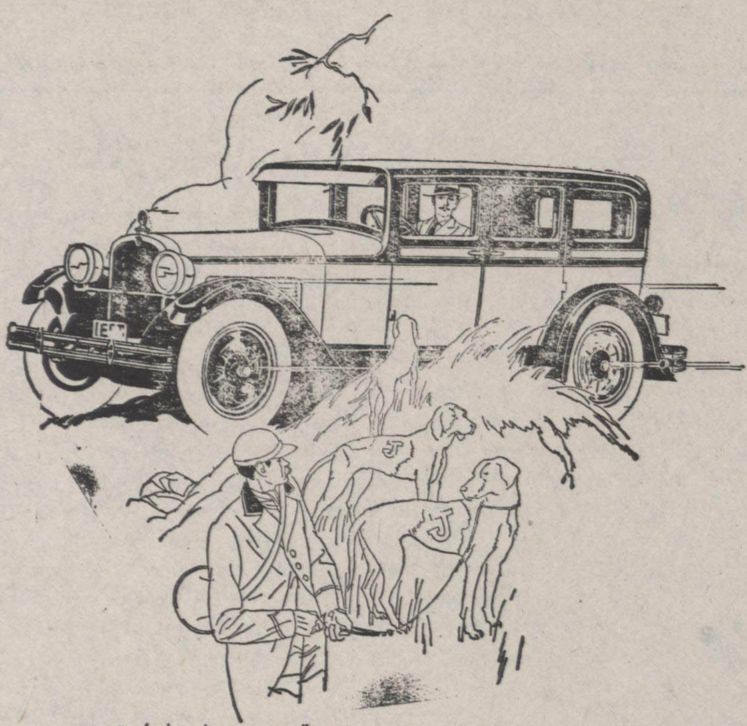
از اتوموبیل های ۶ سیلندر باید قوت و عمل خواست

محقق بدانید که تا بحال هیچ اتوموبیلی یکسانی اتوموبیل های سنبلر ۶ سیلندر داج برادران نیست سرعت کامل و بی صدائی این ماشین که منحصر بخودش است بقدری مطلوب است که رانندگان را صیقلی و خسته نکرده بلکه روح پرور است آنچه که قوه شما لازم داشته باشد بیشتر از احتیاج شما در ماشین های سنبلر وجود دارد و موثر آن بقدری مرتب است که با جزئی اشاره از سکون بمرکت و از حرکت سکون درمی آید زیمی ماشین های سنبلر و روانی چرخهای آن بقدری برای رانندگان مطلوب است زیرا بهترین مهندسی در ساختن آن بکار رفته و همین است که باعث وجد رانندگان را فراهم میسازد ماشین های سواری داج برادران عبارتند سنبلر سیکس - ویکتوری سیکس - استاندارد سیکس