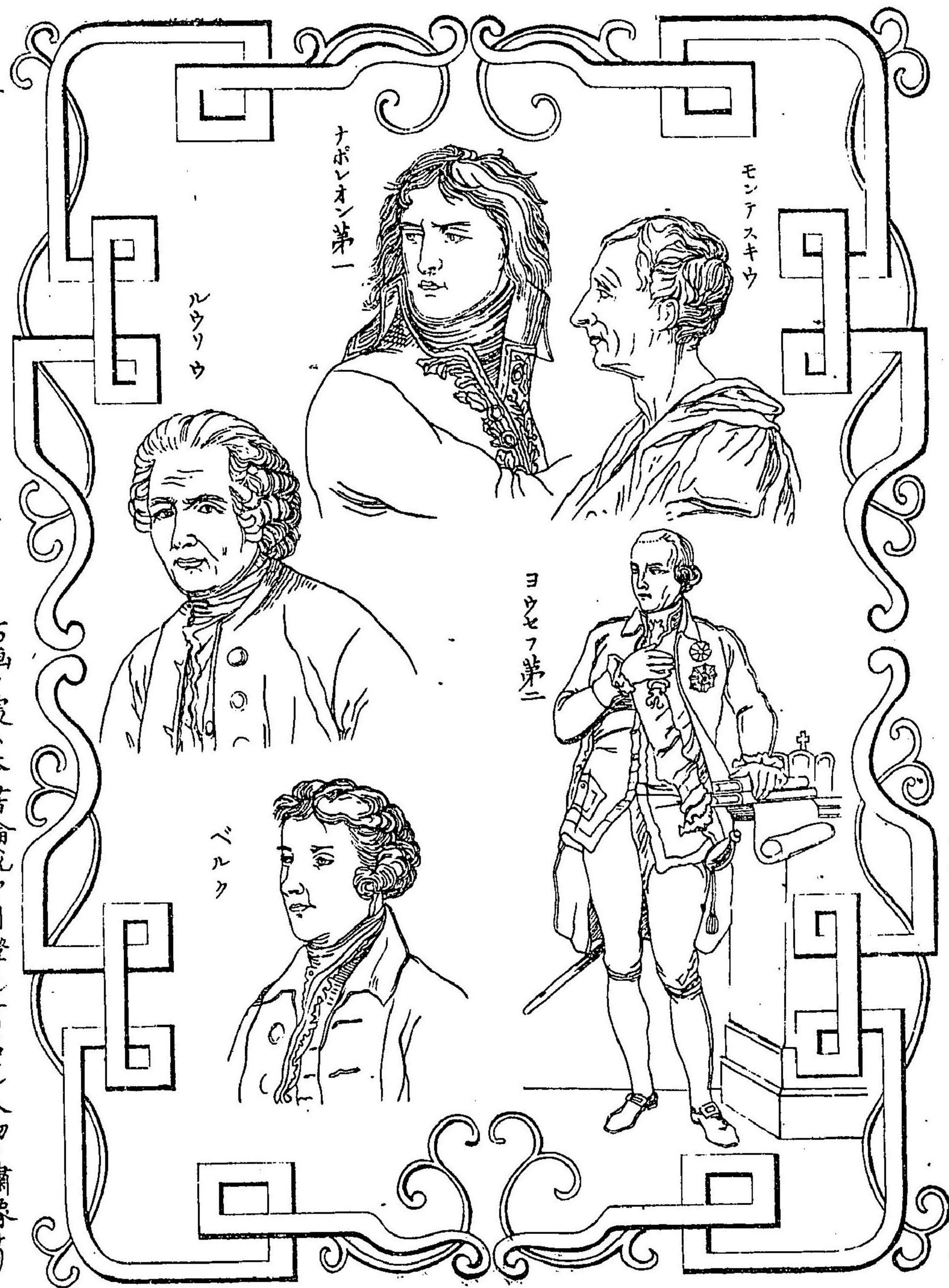
右画々處ハ本書論說中引證スル有名ナル人物ノ繙像ナリ