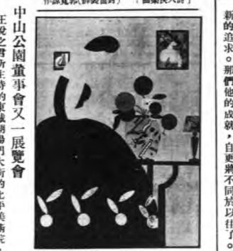
王君悅之現在中山公園畫室中...