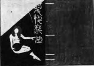
王君悅之現在中山公園畫室中...