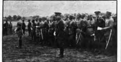
時影良在南昌南立街...