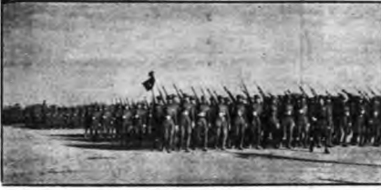
影攝之其兵步隊畫時國庵寺黃在良學張