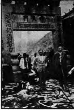
中山公園前門前約「綠林社」...