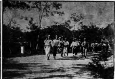
中山公園前門前約「綠林社」...