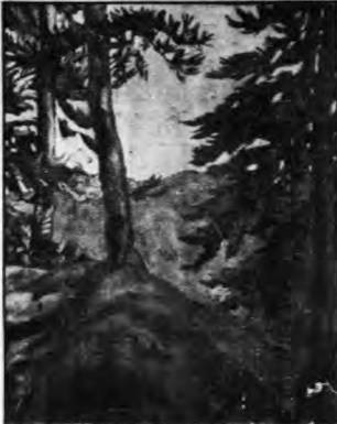
王君悅之現在中山公園畫室中...