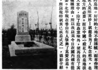
第一之公墓成已公墓安島華