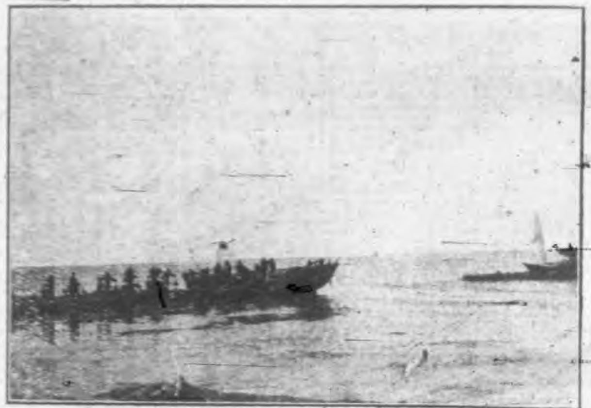
不黃河老河口上塔口情形

△編輯者▽ 國民經濟建設運動委員會安徽省分會 △價目▽ 零售每冊二分 預定全年二十四冊 國內連郵五角 國外連郵二元 每星期一十六日出版 △發行處▽ 國民經濟建設運動委員會安徽省分會