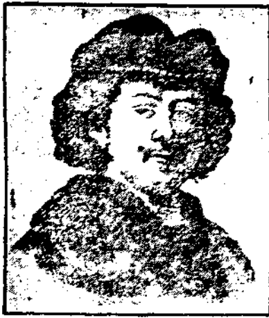
特 蘭 伯 郎