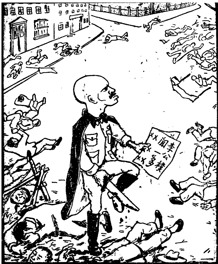
(五) 血濺昆明李聞遺囑暗殺！