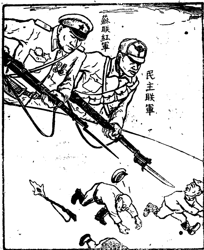
(一) 紅軍參戰，日寇倒台！