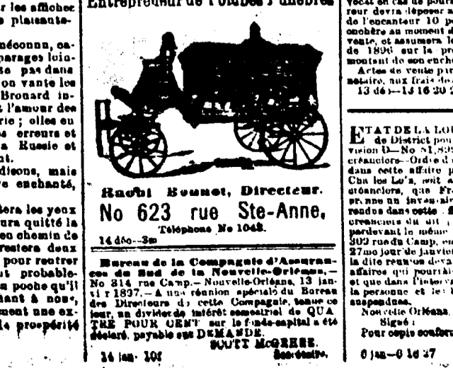
JOHN BONNOT. Entrepreneur de Pompes à l'Ancre.

JOHN BONNOT. Entrepreneur de Pompes à l'Ancre. 1460-3e. Rue de la Nouvelle-Orléans, No 1460-3e.