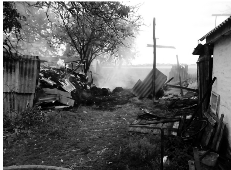
За інформацією Козельщинського районного сектору ГУ ДСНС України у Полтавській області

Травмованих і загиблих немає. Причина займання встановлюється.