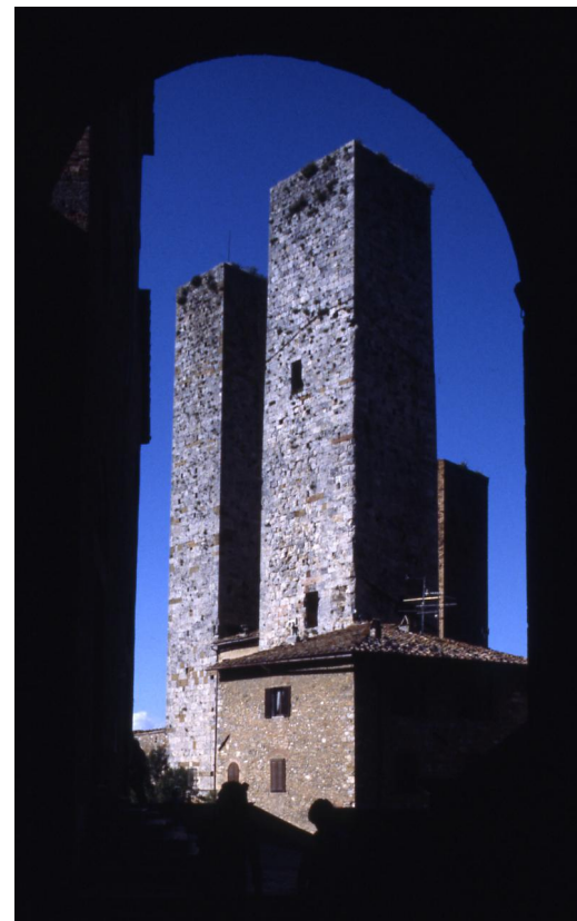
Paolo Monti - Servizio fotografico (San Gimignano, 1978) - BEIC 6358303 Fondo Paolo Monti, BEIC. CC BY-SA 4.0