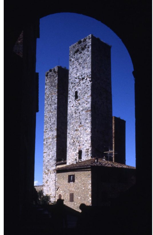
Paolo Monti - Servizio fotografico (San Gimignano, 1978) - BEIC 6358303 Fondo Paolo Monti, BEIC. CC BY-SA 4.0